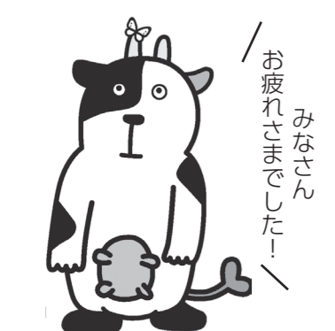
みなさん お疲れさまでした！

A 町長 最近の夏の暑さは警報が発令されるほどで、バス利用者に対して対策が必要であることは理解しています。しかし、バス会社との調整が必要であり、すぐに対応できないという課題があります。このため、帽子を被るなどの自己防衛策をお願いしたいと思えます。