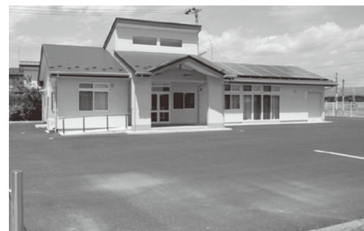
3区集会所の前に遊園地を