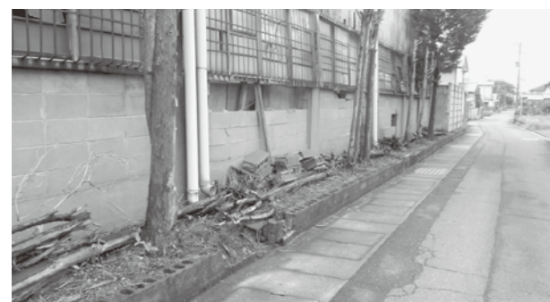
旧東洋鑄工も改修が待たれる

質問 旧東洋鑄工の建物や塀が今にも崩れそうになっているが、町は把握しているか。特に西側の道路に面したコンクリート塀は危険なようだが、道路の安全対策は考えているか。