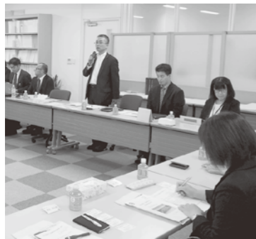
㈱会議録研究所の広報システム研修

広報編集委員会研修が、10月10日(水)・11日(木)に、シェーンバッハ・サポー(東京都千代田区)及び㈱会議録研究所埼玉営業所で実施されました。 シェーンバッハ・サポーでは、町村議会広報研修会で、内容は、①「読み手に伝わる文書の書き方」②「デザイン」の力で、もつと伝わる議会広報紙に」③「最優秀賞及び優秀賞作に見る光彩を放つ編集力」でありました。