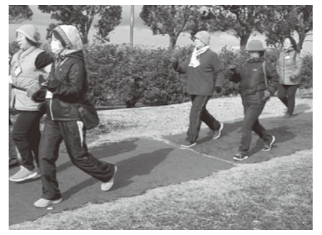
ウォーキング教室