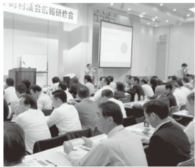
シェーンバッハ・サポーにて広報研修