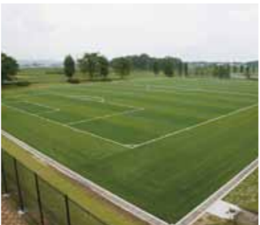
鳥見山多目的広場

一般開放と、夜間利用できる様、ナイターの設置を希望したいと思います。ナイター設置は仕事帰りの大人でも利用出来ますし、子供達の自主トレーニングにも利用できると思います。管理の下、決められた時間で利用できれば、より多くの方がスポーツを通して交流できるのでないでしょうか。鏡石のすばらしい施設をもっと子供達に身近に感じさせてあげたいと切に願います。ご検討よろしくお願致します。