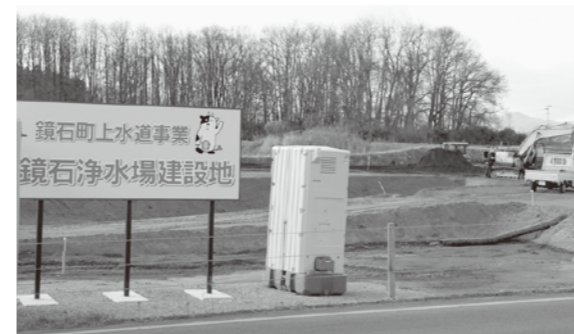
新浄水場建設予定地

質 問 新浄水場建設に伴う、安心・安全・安定的な水道水は、いつ頃から給水できるのか。