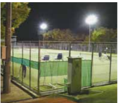
鳥見山テニスコートの夜間照明