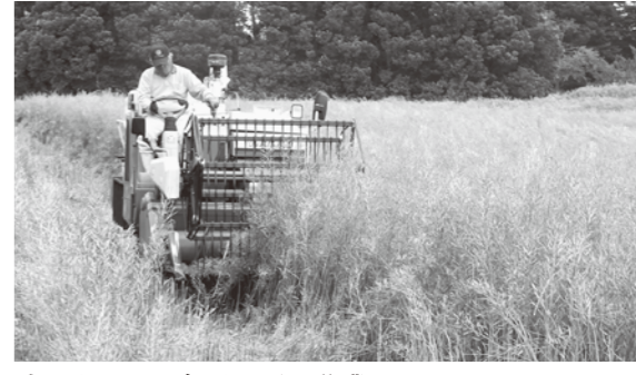
油田計画 えごま刈り取り作業