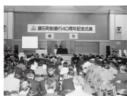
▲町制施行40周年記念式典(平成14年)