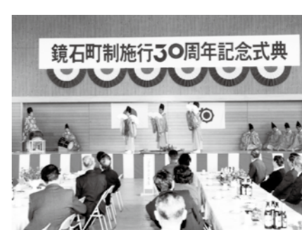
▲町制施行30周年記念式典(平成4年)