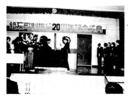
▲町制施行20周年記念式典(昭和57年)