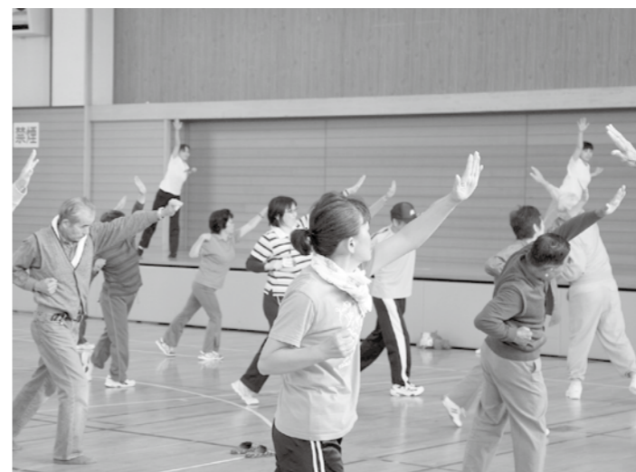
▲体操で心地よい汗を流す参加者の皆さん

また、体操講習会終了後は、かがみいしスポーツクラブによるノルディックウォーキング講習会も併せて開催されました。