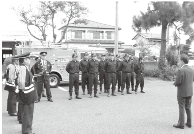
▲遠藤町長から町消防団への引渡し