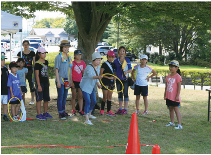
▲トリプルラリー in鳥見山

今年も早いもので10月となりませう。厳しかった夏も少し和らいで、秋の深まりを感じます。秋といえば、食欲の秋、芸術の秋、読書の秋、そして、スポーツの秋。今回は、9月に開催されたスポーツイベントを紹介します。 日頃運動不足を感じている人は、秋の訪れをきっかけにスポーツを始めてみてはいかがでしょうか。 手軽にできるスポーツとして、町ではラジオ体操の普及を図り、地域の健康づくりを推進しています。 また、一人でスポーツを始めるのが難しい場合は、かがみいしスポーツクラブを利用してみると始めやすいかもしれません。