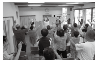
▲「頭の体操」で認知予防

【関係機関との連携】 暮らしやすい地域づくりのために、勉強会を開催したり、ネットワークをつくります。