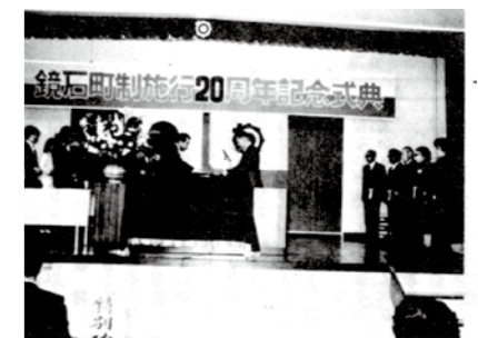
▲町制施行20周年記念式典(昭和57年)