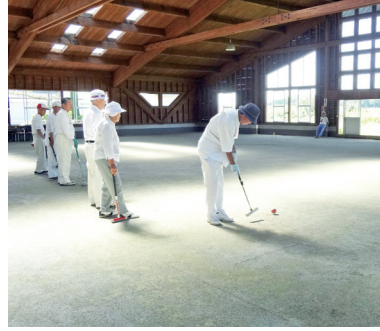
▲町ゲートボール大会

今年も早いもので10月となりませう。厳しかった夏も少し和らいで、秋の深まりを感じます。秋といえば、食欲の秋、芸術の秋、読書の秋、そして、スポーツの秋。今回は、9月に開催されたスポーツイベントを紹介します。 日頃運動不足を感じている人は、秋の訪れをきっかけにスポーツを始めてみてはいかがでしょうか。 手軽にできるスポーツとして、町ではラジオ体操の普及を図り、地域の健康づくりを推進しています。 また、一人でスポーツを始めるのが難しい場合は、かがみいしスポーツクラブを利用してみると始めやすいかもしれません。