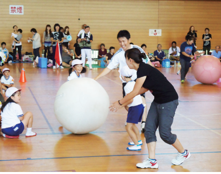
▲鏡石幼稚園運動会