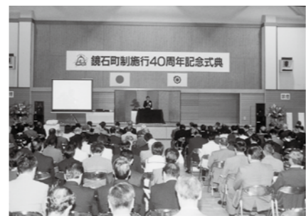
▲町制施行40周年記念式典(平成14年)