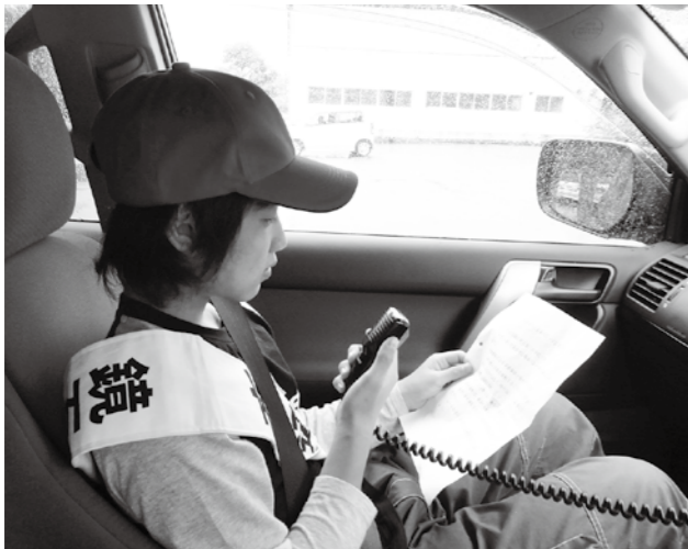
▲元気に交通安全を呼びかける児童