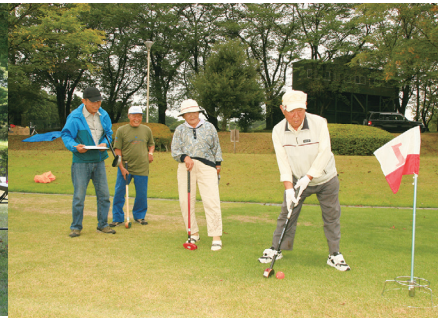
▲高齢者グラウンドゴルフ大会