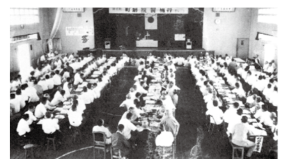
▲町制施行記念祝賀式典(昭和37年)

昭和37年8月1日、鏡石村から鏡石町となり、町立第一小学校体育館において記念祝賀式典が開催され、町制施行50年の節目となる今年の記念式典は、10月17日(水)に鳥見山体育館で開催されることとなります。 50周年記念式典の様子や特別功労表彰者などについては、11月号で紹介する予定です。 なお、記念式典としては、町制施行10周年記念式典(昭和47年)の2年後の昭和49年度全国