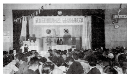
▲町制施行10周年記念式典(昭和47年)