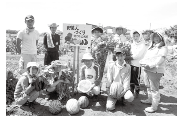
▲たくさんの野菜が収穫できました