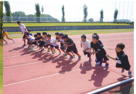
▲かがみいしスポーツクラブ陸上競技記録会