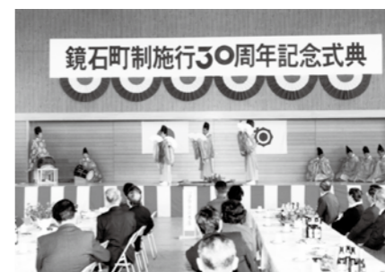
▲町制施行30周年記念式典(平成4年)