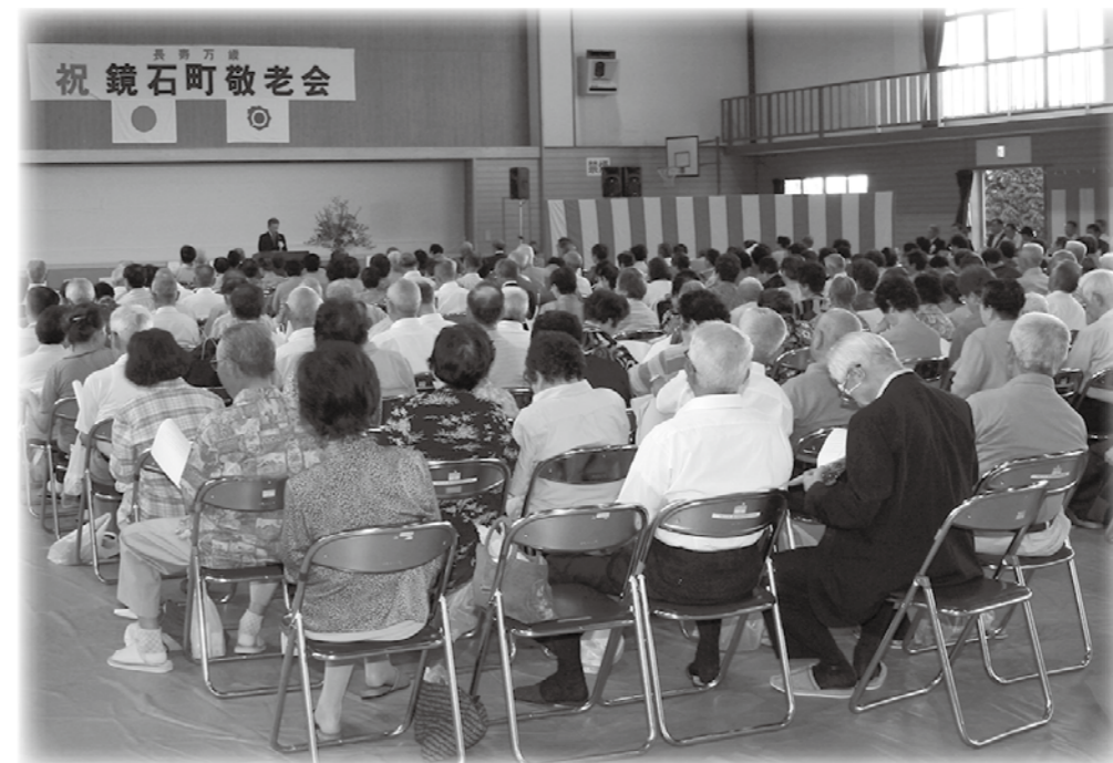
▲平成24年度鏡石町敬老会