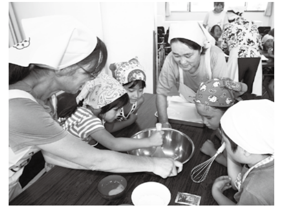
▲クッキーの作り方に興味津々

また、子ども達はクッキーを作り終えた後、手巻き寿司の具をバイキング形式で取って、自分で巻いて楽しみながら食べていました。