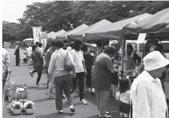
▲たくさんの来場者で会場はにぎわいました

なお、第3回ファーマーズマーケットは6月23日(日)に同会場で行われる予定です。