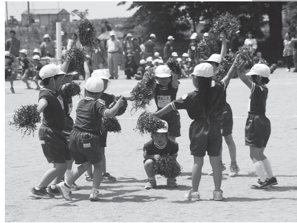
▼かわいいダンスに会場が癒されました(二小)