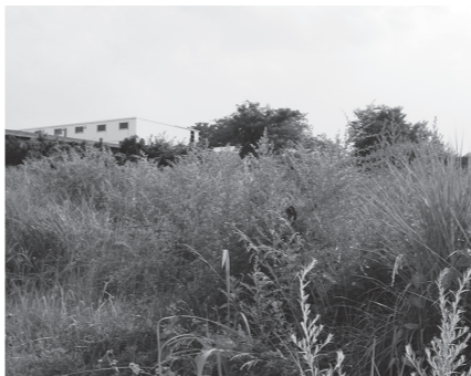
▲早めの除草をお願いします

また、犯罪の温床となることもありますので、空き地は土地の所有者や管理者が定期的な除草や清掃など責任を持って管理をお願いします。