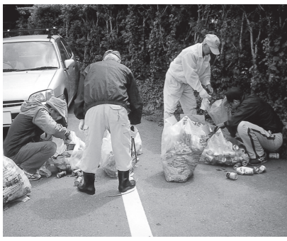
▲ゴミ拾いをする環境を考える会のメンバー