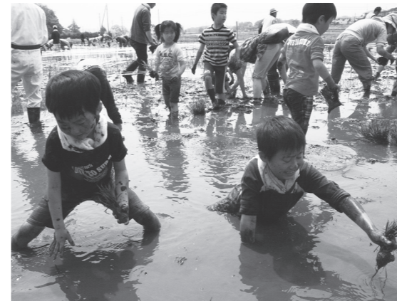
▲泥だらけになっても楽しく田植え