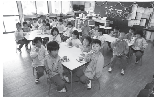
▲ちゃんと歯みがきしています

年までは「歯の衛生週間」でしたが、今年度からは「歯と口の健康週間」となっています。