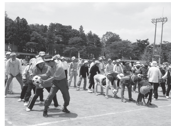
▲スポーツを楽しむ高齢者のみなさん