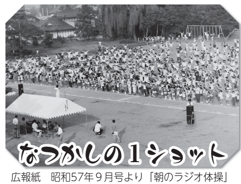
なつかしの1ショット 広報紙 昭和57年9月号より「朝のラジオ体操」

表紙のラジオ体操ですが、たくさんの方が参加で大盛況でした。みなさんも健康への関心が高いという事ですね。さて、私のダイエツト挑戦といえ。先日座った瞬間「びりっ」という音が...。そう、スーツのお尻部分に破れた音です。去年購入したのですが、痩せる予定でちよつと細目のスーツを買ったのが原因です。ただし、決して体重が増えたわけではない(笑) 特集で紹介しましたが、6月は環境月間ということ、で、エコとダイエツトを兼ねて自転車で町を走り回る広報マンが現れるかも。みなさんもエコにチャレンジしてみましょ。