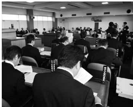
▲町執行側も通常の議会と同じ緊張感