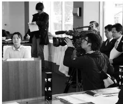
▲テレビ局も取材に訪れました