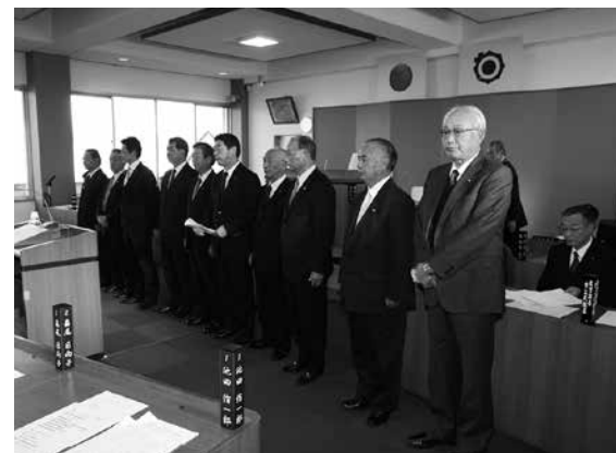
▲町議会議員のみなさんも子ども議会へ参加