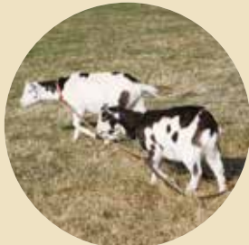
元気いっぱいカラヤギのブッチくん(左)とブッチくん(右)