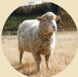
とても人懐っこい羊のめいちゃん