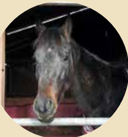
鏡石町の名前が入った馬「ユメカガミ」