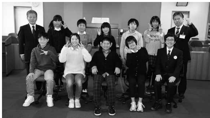
▲子ども議会終了後はいつもと同じ笑顔に戻った子どもたち