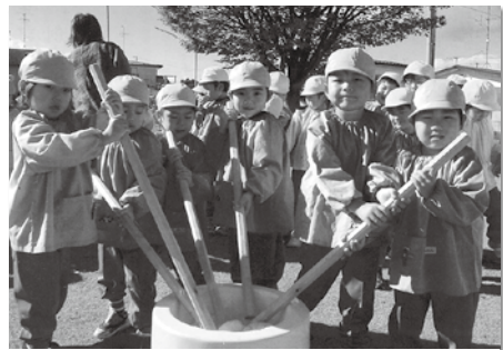
広報紙 平成19年1月号より 「餅つきを楽しむ鏡石幼稚園児」

広報ページのびびり あけましておめでとございます。今年も広報がみいしをよろしく願います。さて、新年号の表紙はいかがでしたでしょうか?皆さんの素敵な笑顔が集まり、その上、みなさんからのありがたい一言もいただき、広報をやっていくことができました。 今年、以前から企画していることを実施しようとしていたこと、大変わだいたいは思いますが、町民のみならず、のどと信じて頑張ります。広報を見てもらえれば、このことかと思っております。楽しみに待っています。 なつかしの1ショット