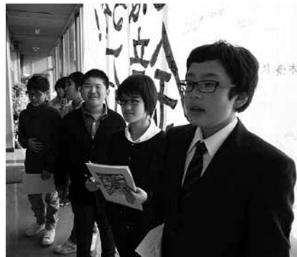
▲子ども議会入場前の緊張した様子 の子ども議員