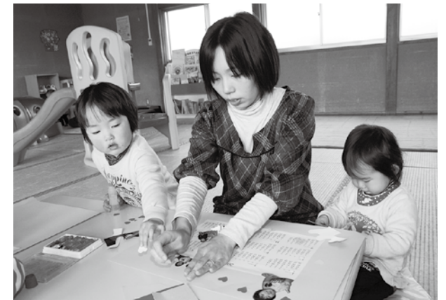
▲親子で協力してのカレンダー作り

つどいの広場は、乳幼児とその保護者を対象に、毎週月・水・金曜日の午前10時から午後4時まで開かれています。