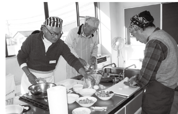
▲慣れない手つきながらも上手に料理する参加者