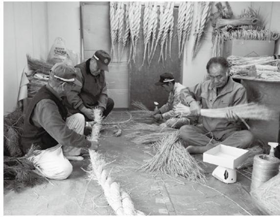
▲神社用の大しめ縄を作成