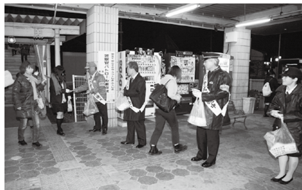
▲鏡石駅で啓発活動をする参加者

また、出動式後は、参加した皆さんが3班に分かれ、町内の商業施設や駅などでチラシやティッシュを配り、年末年始の防犯を呼びかけました。