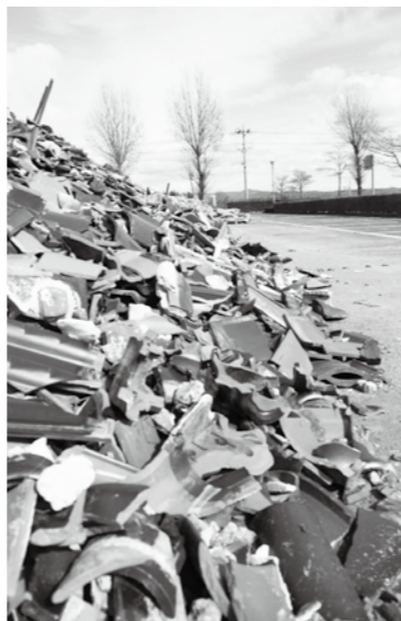
▲震災ゴミの回収はしばらくの間継続する予定です