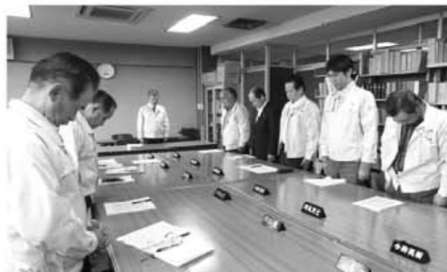
▲町長をはじめ町関係者が犠牲者へ黙とうを捧げました