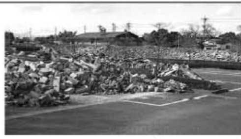
▲鳥見山公園の駐車場に積み上げられた震災ゴミ

3月11日に発生した地震により、町内では多くの建築物が倒壊しており、町ではがれきなどの震災ゴミを震災後、随時回収しました。当初、鳥見山公園北側駐車場ががれきや廃木材等の回収を行いました。写真のように大量のがれき類が集まり、満杯になったため、東町仮置き場を整備し、回収を実施しました。