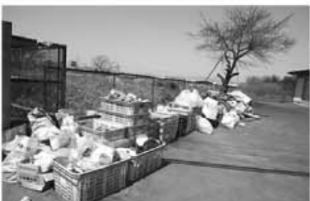
▲マナーを守って気持ちのよい地域づくりにご協力ください