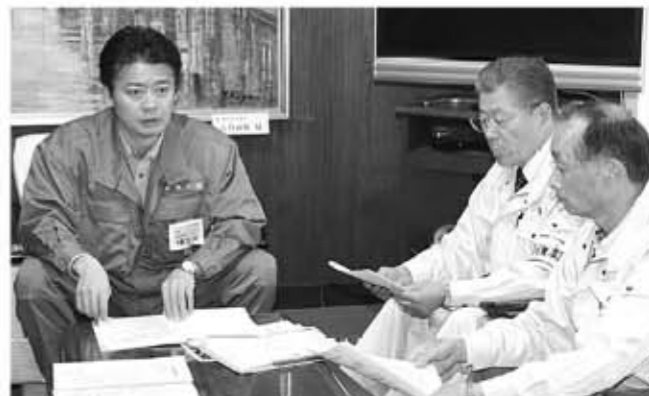
▲遠藤町長らから被害について説明を受ける玄葉大臣