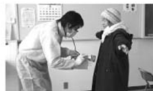
▲浜通りからの避難者に対して行われたスクリーニング調査 (全員基準値内でした)

今回の震災で後々まで様々な場面で影響が出るのが予想される福島第一原発の事故。町でも通常より多い放射能が検出されるなど、皆さんも不安に感じている事と想像されます。 現状、町周辺で測定されている水や空気中の値は、基準値より下回っており、直ちに健康に影響が出る値ではありません。皆様には正確な情報を元に冷静な行動をお願いいたします。 一方、県内産の葉物野菜を中心に基準を超える物質が検出されたことから摂取及び出荷を差し控えるよう国で通知されました。これらの野菜等については、摂取しないよう願います。