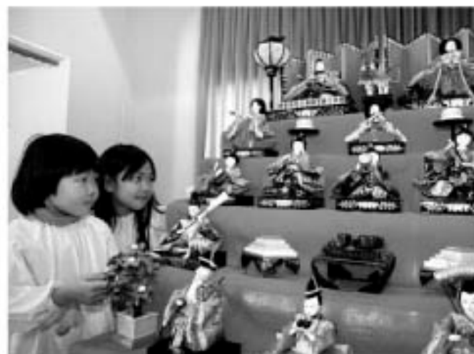
▲きれいに飾られた人形をうれしそうに眺める子どもたち。