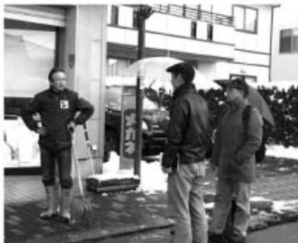
▲付近の住民から情報を集める隊員の皆さん