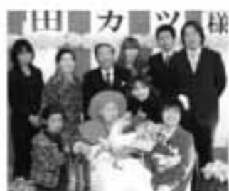
▲家族に囲まれて笑顔のカツさん