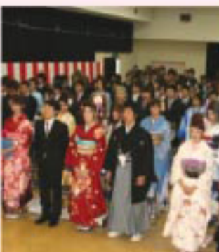
▲色とりどりの着物で着飾った皆さんで会場は華やかな雰囲気

「成人を迎え、私は周りの人たちに支えられ、ここまで生きてこれたと改めて実感しています。苦しいことや悲しいこともまだまだたくさんあると思います。どんな時も笑顔で、感謝の気持ちを忘れずに、強くいい女に成長していきたいです。」