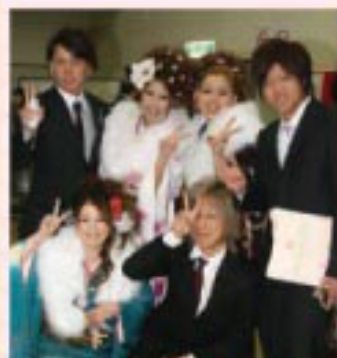
▲会場のおちこちで友達との記念撮影

「このたび成人を迎えることができ、とてもうれしく思います。家族をはじめ、私を支えてくださった方々、故郷鏡石町に感謝の気持ちを伝えたいと思います。恩返しとなるように、社会に貢献したいと思います。」