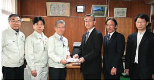
▲学校法人工学院大学からは、震災で壊れた学校用理科教材を多数贈っていただきました