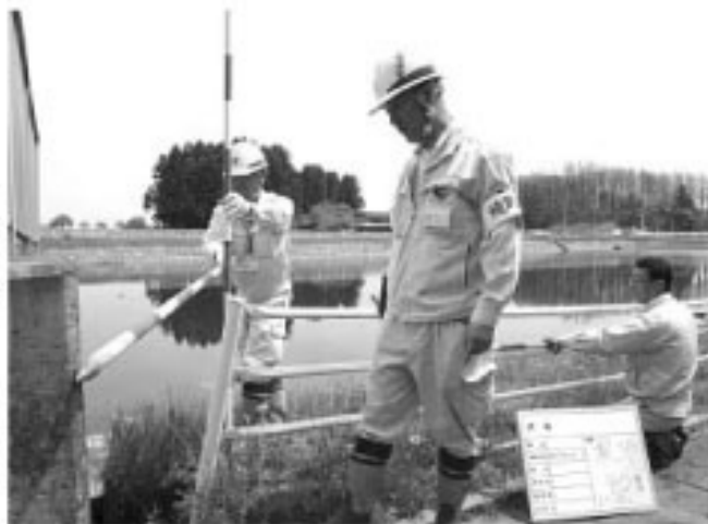
▲職員の数が不足している現場作業や調査作業に活躍していただきました

不慣れな職場においても、これまでの豊富な経験と知識で町の復興への大きな力になっていただきました。