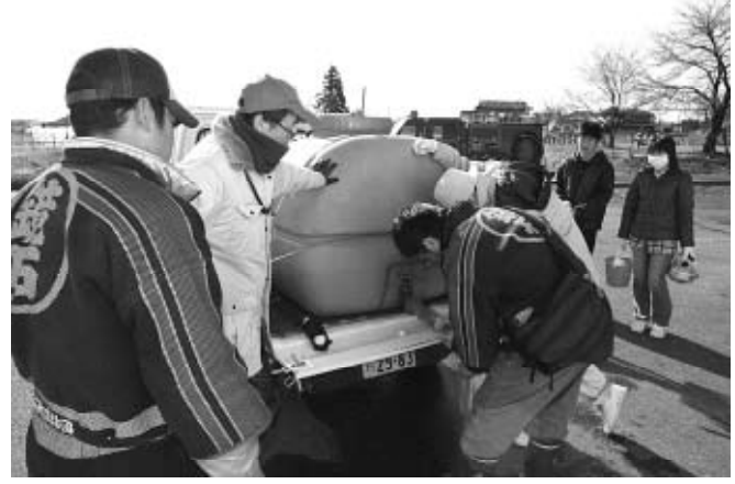
▲給水作業では、作業の補助や広報などの活動を行いました

今回の震災は、これまで団としても経験のない災害だっただけに当初は戸惑いながらの活動でした。それでも震災直後から被害状況の確認やがれきの撤去作業の補助、特別警戒の実施など、日ごろの訓練の成果を十分発揮し、組織的な支援活動ができたのではないかと考えています。また、同時期に建物火災や野火火災が発生するなど、気の抜けない時期が続きましたが、団員にあっては、自らの家や職場が被災している状況にもかかわらず、団活動へ協力してもらい感謝しています。今回の震災では、団としてはもちろんですが、地元地域