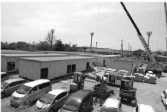
▲町公民館グラウンド、前山町営住宅跡地、南部工業団地緑地、成田保健センターグラウンドに建設されました

応急仮設住宅は、震災により、今までの住宅に住むことができなくなってしまった皆さんの一時的な住まいとして建設され、6月上旬から、入居が始まっています。また、今回の仮設住宅は、津波により壊滅的な被害を受けた浜通りの住民の方への住居としても提供できるよう、福島県により建設されており、被害に遭われた皆さんの生活の立て直しの場として、機能する予定です。