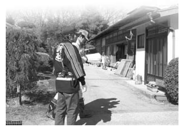
▲地震直後から地元地域の被害状況の調査を行いました