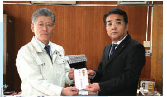
◀◀(社)全国旅行業協会では、富山県で行われたイベントで町の特産物の販売を行い、その売上げを寄付いただきました。イベントには町職員も参加し、町のPRを行いました