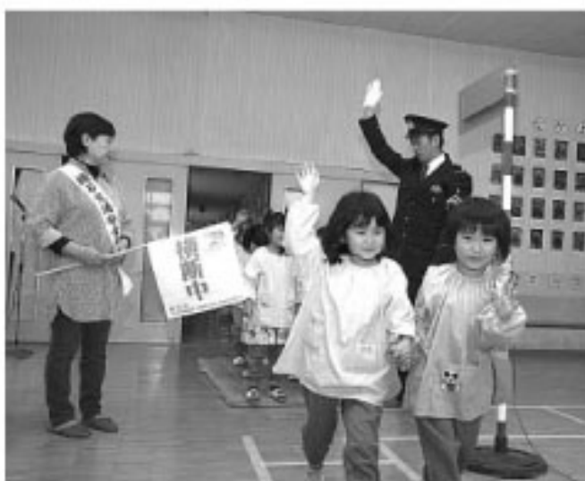
▲模擬信号機を使って、横断歩道を渡る練習、ちゃんと右左の確認できたかな（鏡石幼稚園）