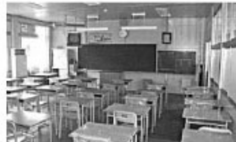
◀イメージ写真 イメージ写真▶