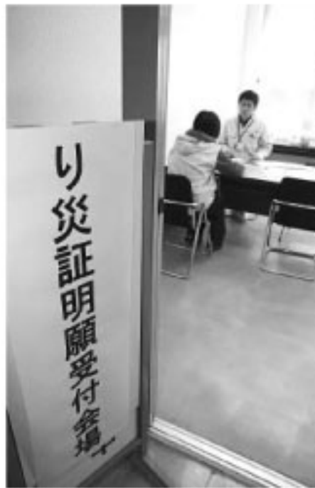
▲特設された受付会場には多くの方が訪れました

き影りになりました。 申請のあった世帯を町職員が外観目視による一次調査を実施し、国で定めた規定に照らし合わせ判定した結果、全壊と判定された家屋が154件、大規模半壊と判定されたものが79件となりました。 被災証明書は各種の公的支援制度や義援金の交付を受けの際に必要な書類ですので、被害に遭われた世帯で証明書の必要な方は、被害に遭った家屋の写真と、認印、身分証明書を持参の上、窓口で申請して下さい。