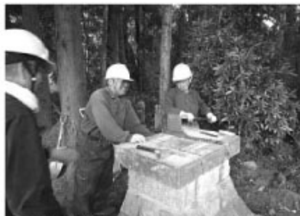
▲重機や原材料も地域の皆さんで持ち寄りました