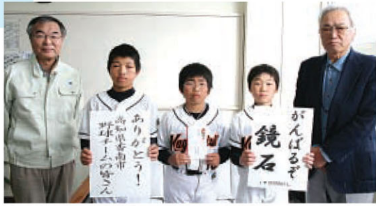
▲高知県香南市少年野球チームより志を同じくする町のスポーツ少年団へ寄付金