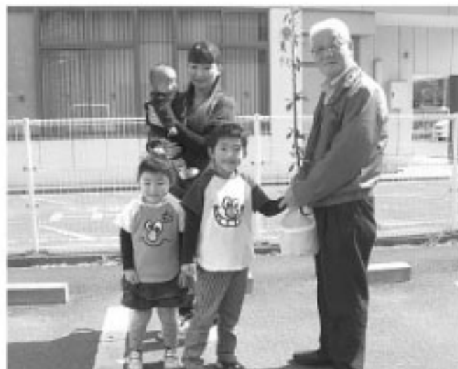
▲苗をプレゼントされて兄弟みんなで、にっこり笑顔