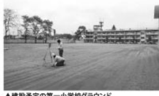
▲建設予定の第一小学校グラウンド

町では、地震の被害により第一小学校が被害を受け、家屋の応急危険度判定調査によって「危険」と判定されたため、仮設校舎の建設を決定しました。 第一小学校の校舎は、校舎内の柱や壁に亀裂が入るなど、継続して使用することが困難となりました。そのため児童は、4月から、1年生が可構造改善センター、2年生から6年生までが第二小学校の協力を得て、教室や体育館などで授業を行っていました。