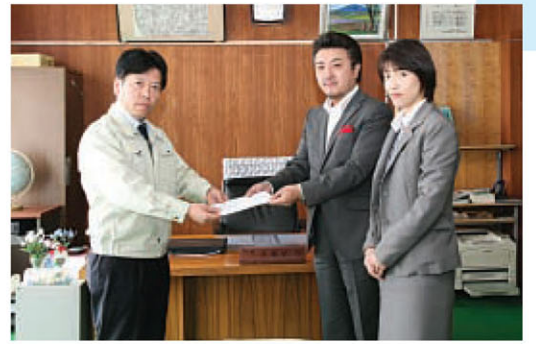
▲町営プールの指定管理者であるエスエフコーポレーション様よりも義援金を頂きました