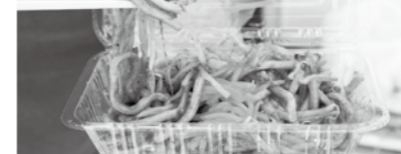
▲太麺が特徴の浪江焼きそば、作ってくださった皆さんに感謝