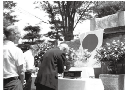
▲現在の平和な日本の礎となった御霊に感謝の祈りを捧げました