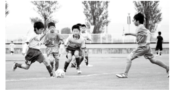
▲目指せ! 未来のサッカー日本代表

【鏡石チーム戦績】小学生6年生以下「ホワイトチーム」Aブロック準優勝、「イエローチーム」Bブロック4位 小学生4年生以下 3位、6年生以下 フットサル 準優勝