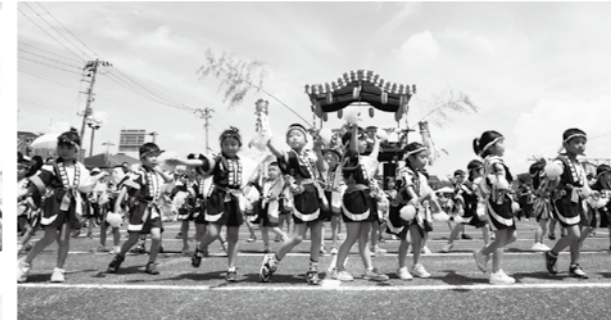
▲ちびっこYOSAKOIは、夏の太陽に負けない熱い踊りを披露