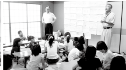
▲ボランティア終了後は、事後研修が行われ、活動を終えての充実感を話合っていました