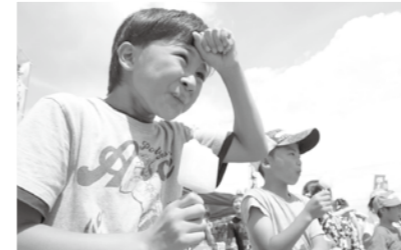
▲アイス早食い競争、冷たいアイスに頭がキーン(涙)