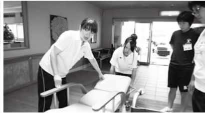
▲鏡石ホームでは車いすに体験搭乗、介護される側の気持ちを学びました