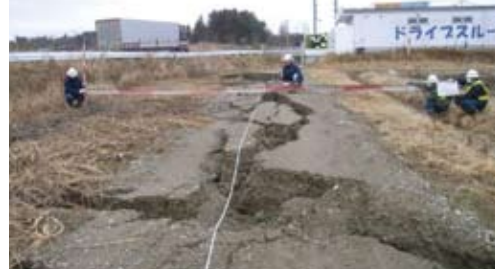
▲国道4号線コーナスタンド付近

東北地方太平洋沖地震により、被災された方々に心からお見舞い申し上げます。 本地震により幹線用水路(羽鳥疎水)も被災しており、その復旧を鏡石町においては図中の枠囲い箇所を開削して行います。工事中には何かとご不便をおかけしますが、ご理解をお願いします。