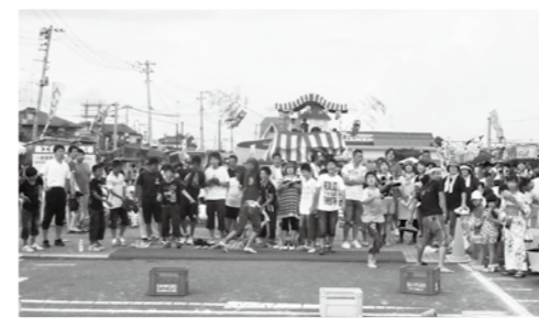
▲「そーれ!」空高く舞上がったスリッパ、だれが一番飛んだかな