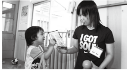
▲お姉さん保育士さんは子供たちに大人気