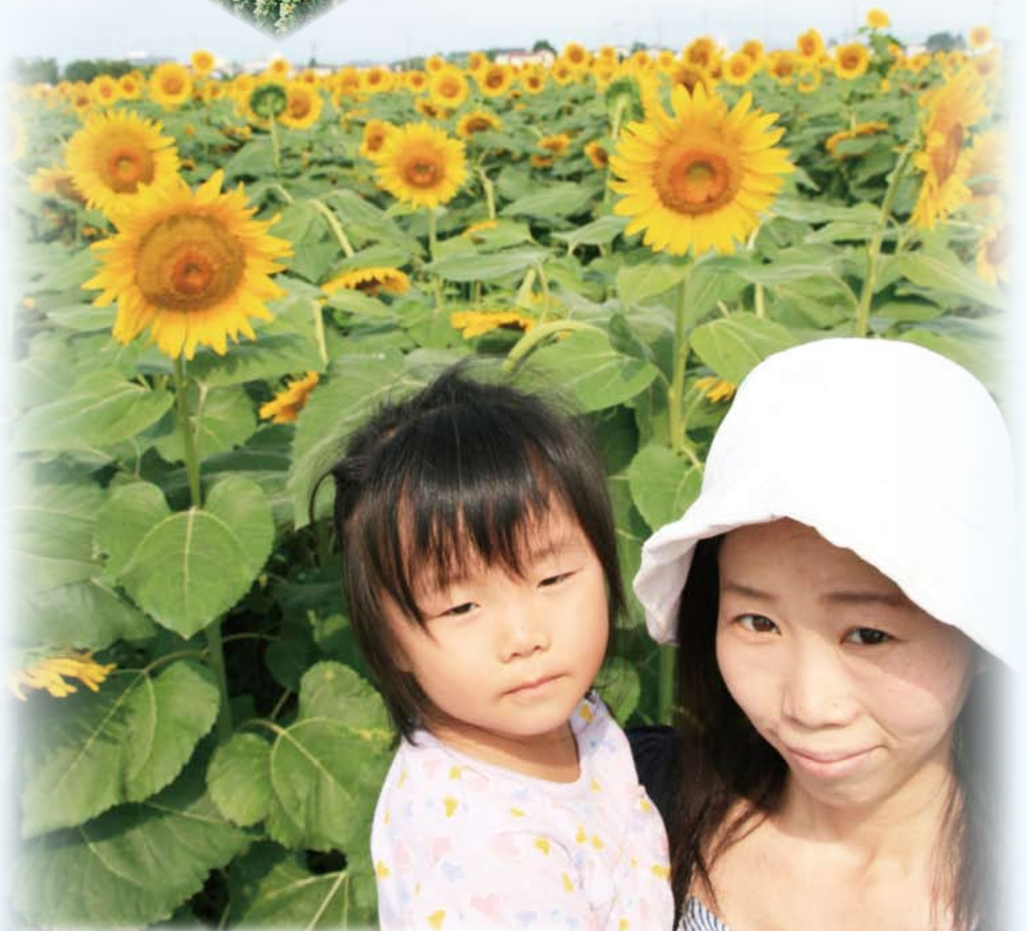
▲「花咲か復興プロジェクト」より 町に一面のひまわり畑が出来ました。ひまわりのように力強く上を向いて頑張ろう！ 撮影協力 (有)稲田電設、モデル協力 熊耳さん親子(岡ノ内)