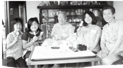
▲一人暮らし高齢者の訪問では、おばあちゃんたくさんお話ししてきました