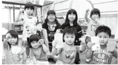
▲幼稚園のお友達へ手作りのポーチと髪留めをプレゼント

また、受け入れた施設の側でも、子供たちの熱心な活動に助けられたと、感謝の声が上がっていました。