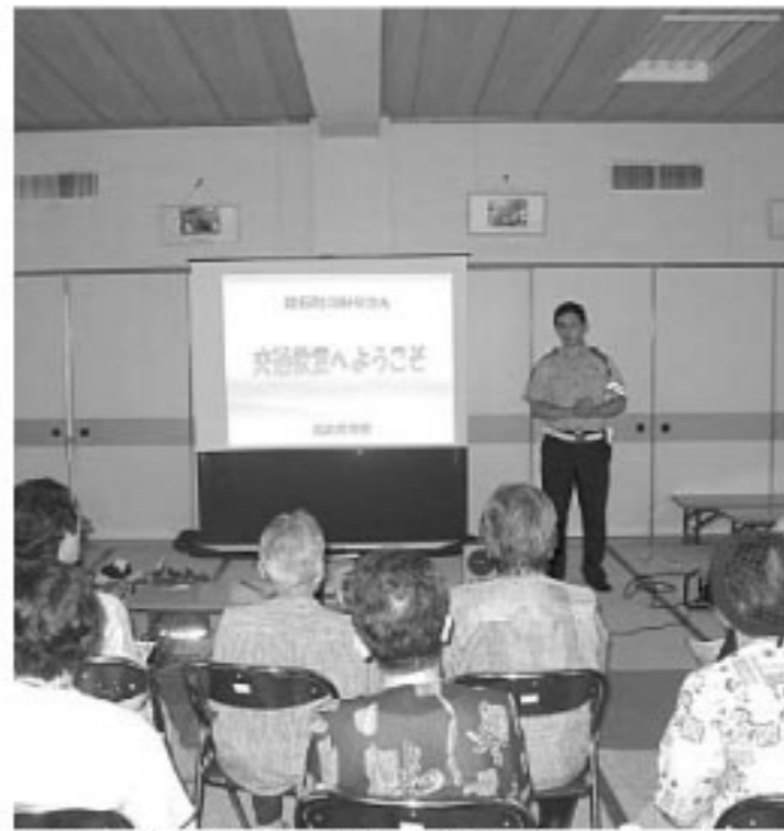
▲鏡石町老人福祉センターで行われた交通安全教室の様子

町の交通安全協会では、高齢者向けの交通安全教室を随時行っていますので、ぜひ受講して、安全な暮らしの一助としてください。