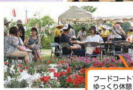
フードコートで花に囲まれてゆっくり休憩