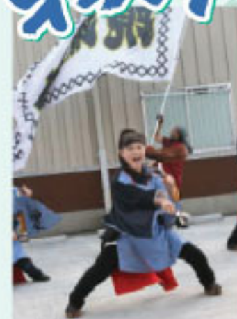
▲今年もYOSAKOIチームのみなさんが祭りを盛り上げました