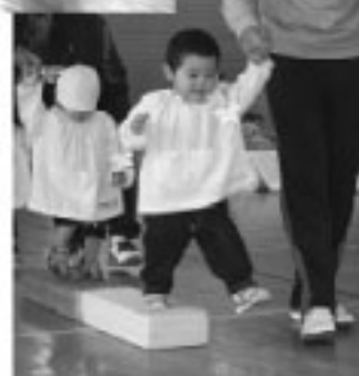
お父さんと一緒にゴールを目指せ (町立保育所)