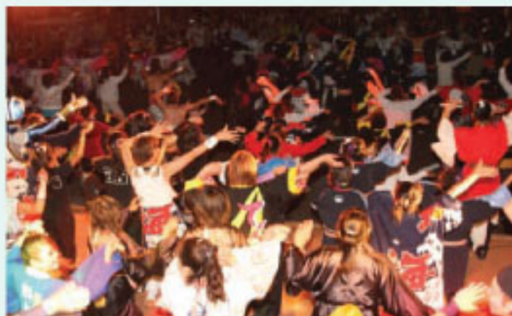
▲夜もお祭りの熱気はそのまま