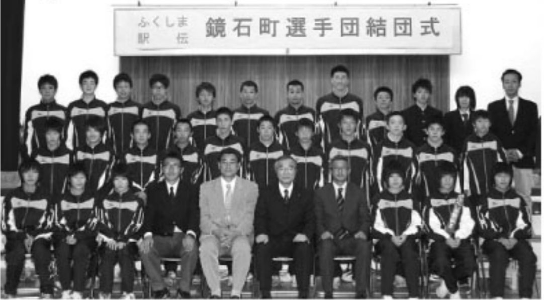
▲平成22年度 鏡石選手団

第22回市町村対抗福島県縦断駅伝競争大会(ふくしま駅伝)が11月21日(日)午前7時40分、白河総合運動公園をスタートし、県庁までの96.2kmを16人の選手が力走します。今年は何んなドラマが待っているでしょうか。今年の選手たちを紹介します。