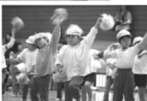
▶わたしダンス上手でしょ (町立幼稚園)