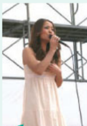
◀歌手門倉有希さんの美声に観客が魅了されました