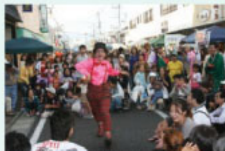
▲大道芸人のストリートパフォーマンスにみんな大笑い