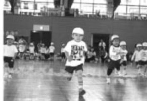
▲一番目指してよーいドン (町立保育所)