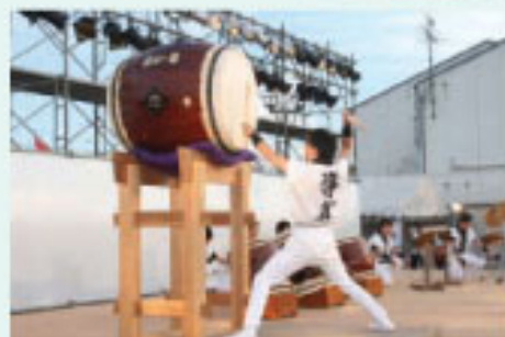
▲迫力満点の鏡導真太鼓