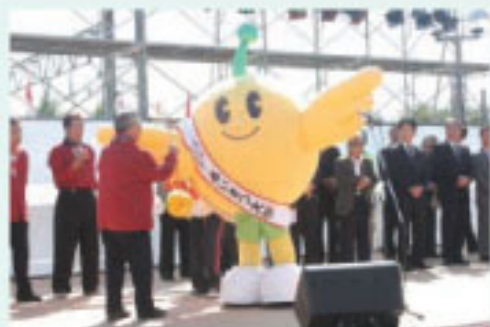
▲キビタンも祭りの盛り上げに一役買いました