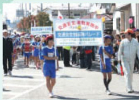
▲交通安全を願う一、二小児童による鼓笛隊パレード