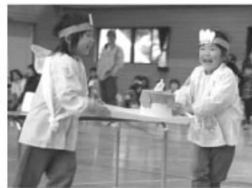
▲ケーキを落とさず上手に運びましょう (町立幼稚園)