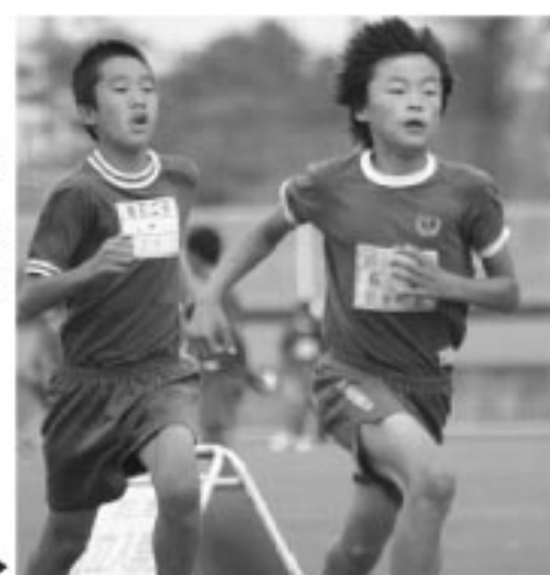
男子1,000m走で新記録を出したゴール前でのデットヒート▶