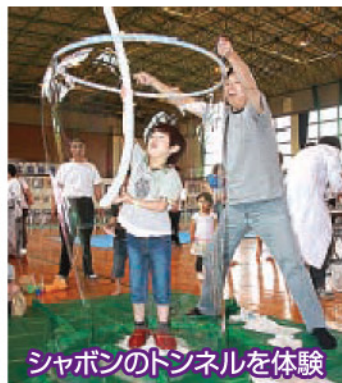
シャボンのトンネルを体験