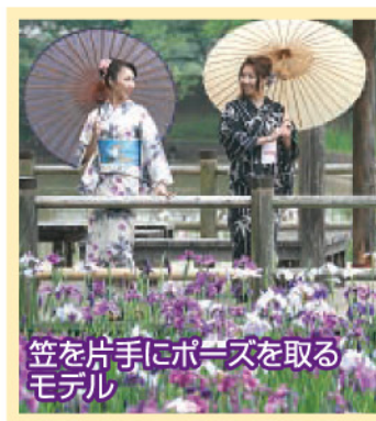
笠を片手にポーズを取るモデル