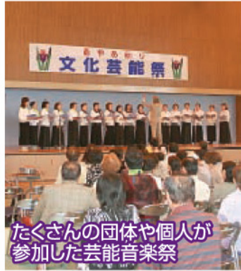
たくさんの団体や個人が参加した芸能音楽祭