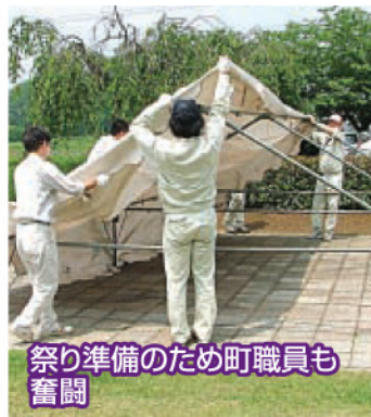
祭り準備のため町職員も奮闘