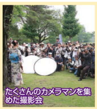
たくさんのカメラマンを集めた撮影会