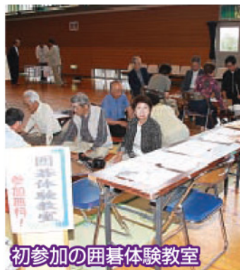
初参加の囲碁体験教室