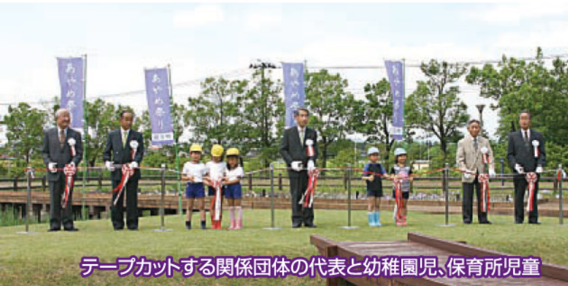
テープカットする関係団体の代表と幼稚園児、保育所児童