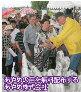
あやめの苗を無料配布するあやめ株式会社

7回目となる鏡石あやめ祭りは、6月20日(土)、21日(日)鳥見山公園内で行われ期間中約2万人の来場者が訪れました。15日(月)には、あやめ園の開園式が行われ、関係者約300人が出席しました。 あいにくの雨のため、プログラムの一部が変更となりましたが、あやめ撮影会、文化芸能祭などさまざまな催しが行われました。ここでは、祭りの様子を写真で紹介します。