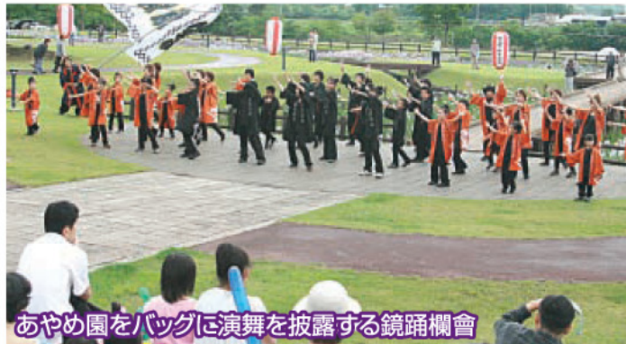
あやめ園をバックに演舞を披露する鏡踊欄會