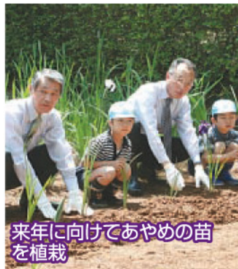
来年に向けてあやめの苗を植栽