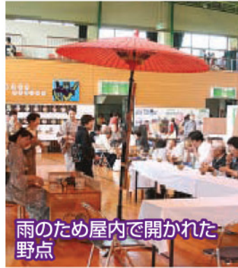
雨のため屋内で開かれた野点