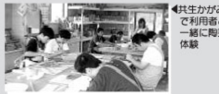
◀共生かがみで利用者と一緒に陶芸体験