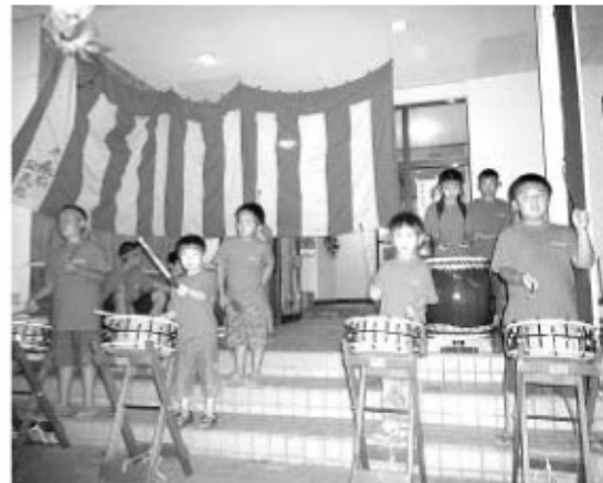
▲真新しい太鼓で練習する子どもたち

久来石区は、久来石盆踊り太鼓6張りを整備しました。太鼓の整備には、財団法人自治総合センターが実施するコミュニティ助成事業を受けての実施となりました。太鼓のほかにもテントなども整備され、8月14日、15日の2日間は盛大に盆踊りが行われました。