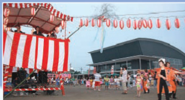
▲夏の風物詩「盆踊り」には大きな人の輪が