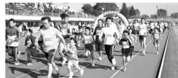
親子手をつないで力走(昨年の大会から)

や交通規制などご協力をお願いします。 参加料 ①駅伝競走の部 ①チーム 8,000円 ②ロードレースの部 ①小・中学生 1,000円 ②高校生・一般 2,000円 ◎親子 3,000円 申込み方法 町公民館にある募集要項の「払込取扱票」に記入押印の上参加料を郵便局から振り込むか直接、公民館に持参してください。 申込期限 10月1日(木)