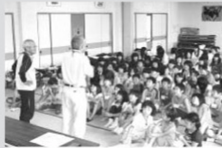
▲全員が出席したオリエンテーション