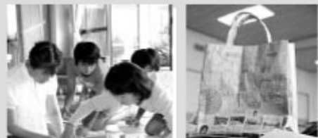
▲出来上がったエコバッグ