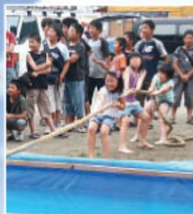
▲力を合わせて「ソレーツ！」