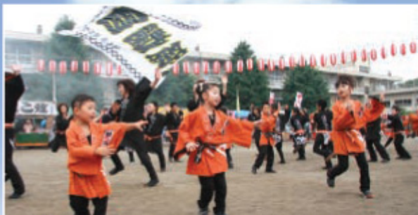
▲子どもはオレンジ、大人は黒のハッピーを身に付け「セイヤー！」