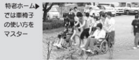
特老ホームでは車椅子の使い方をマスター