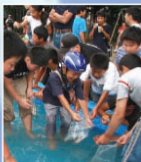
▲すべる魚を上手に手づかみ

このコーナーへ掲載いただける我が家のアイドルを募集しています。詳しくは町職員までお問い合わせください。☎82-2111