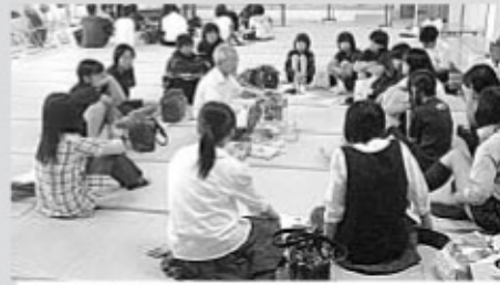
▲戦争の体験談に耳を傾ける受講生

小・中・高校生を対象としたサマーショートボランティアは、7月28日(火)から9回の日程で行われ、約80人が受講しました。町ボランティアセンターの主催。期間中は保育所や特老ホームなどでボランティアを体験するカリキュラムが用意され、受講生は興味のあるものを選んで参加していました。事後研修では、受講生は活動の感想を発表した後、平和について考えるため、戦争体験者5人の話を聴きました。この事業は、毎年行われており、年々受講生を増やしています。