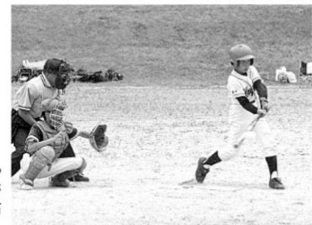
▲思い切ったスイングはナイスバッティング