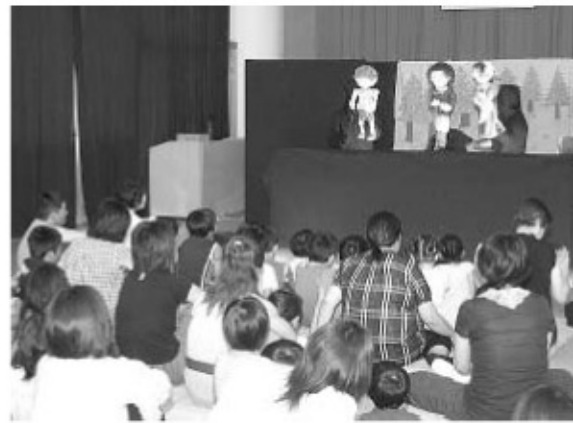
▲かわいらしい人形が出演する人形劇

福島大学児童文化研究会人形劇部による人形劇公演は、8月13日(木)町図書館で行われました。当日は、約60人の親子が鑑賞に訪れ、「ちいさなあくまのおくりもの」などが公演されました。この人形劇は、中通りの一部の町村で行われています。