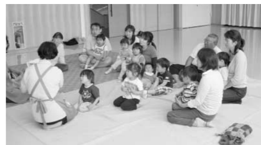
おひざにだっこのおはなし会の様子