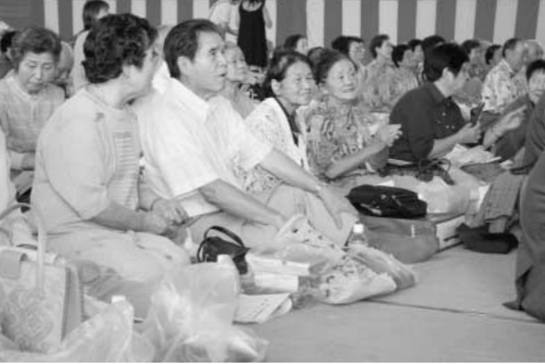
平成19年度敬老会より

平成20年4月から75歳以上（一定の障がいがある方は65歳以上）の高齢者の方を対象に、新たに「後期高齢者医療制度」が創設されることになりました。今後、みなさんにはパンフレットなどを通してお知らせしていくこととなります。該当される方がいらっしゃる世帯の方は町からの配布物に注意してご覧ください。