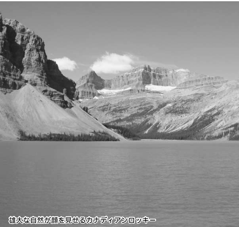
雄大な自然が顔を見せるカナディアンロッキー