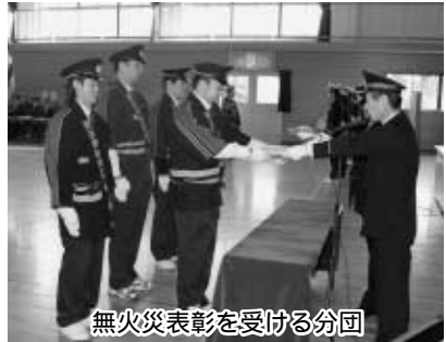
無火災表彰を受ける分団

1月4日(木)午前10時30分から鳥見山体育館で消防団出初め式が開催されました。当日は、出席者全員で町内の無火災を祈願した黙とうをしました。また、通常点検では、消防団員、女性消防隊は勇姿を現していました。式終了後には、防火パレードが行われました。