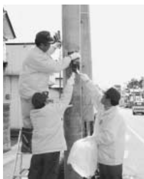
ピンクチラシ撤去作業の様子

増えることは、引いては町の治安を悪化させ、重大な犯罪の引き金にもなりかねません。「どんな小さなことでも犯罪は許さない」という強い意識を地域ぐるみで形成し、安全安心な鏡石町を作りましょう。