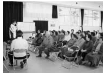
介護予防を学習する生徒

いきいき学級(本校)では、1月17日(水)午後1時から町公民館で介護予防教室を開催しました。