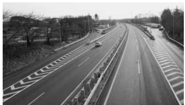
社会実験が決定した東北自動車道鏡石PA付近

須賀川警察署調べによると、鏡石町における犯罪発生状況は、下の表で分かるように、平成17年には前年比で大幅な減少を記録したものの、平成18年では前年比で約5割増加しています。