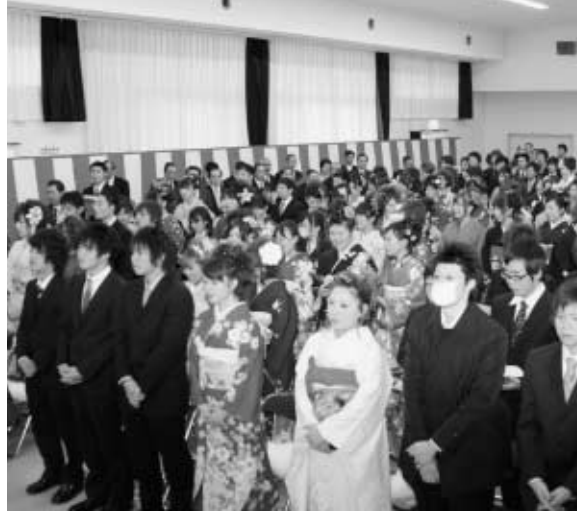
華やかな衣装を身につけた新成人

1月7日(日)午前11時から町公民館で成人式が開催されました。今年は男性106人、女性91人、合計197人が成人を迎え、社会の仲間入りをしました。