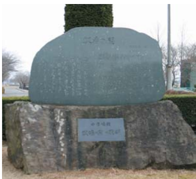
鳥見山公園の牧場の朝の歌碑

今日14日、文化庁は「親子で歌いつこう」日本の歌百選」を発表し、町のシンボル曲「牧場の朝」が日本の歌百曲に選ばれました。 「さくらさくら」など古くから広く親しまれている曲や、2003年にSMAPが歌いヒットした「世界に一つだけの花」(作詞作曲・槇原敬之)など、世代を問わずに口ずさめる曲が並びました。(下の一覧表参照) 日本の歌百選は、全国からはがきや電子メールなどで公募し、計6,671通、895曲の中から101曲が選ばれました。