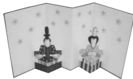
このような作品が出来上がります

や集荷 ②貯金保険の集金など なお、鏡石郵便局は、窓口業務のみを取り扱う郵便局となります。 その他 ①郵便番号は変わりません。 ②配達回数は現在と変わりません。(配達経路は変わります。) ③ポストの取集回数や時刻は、若干変わることがあります。 問い合わせ先 鏡石郵便局 ☎62 2300