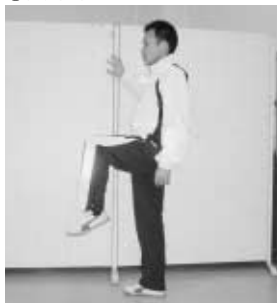
①太もも上げ ゆっくりと太ももを上げましょう