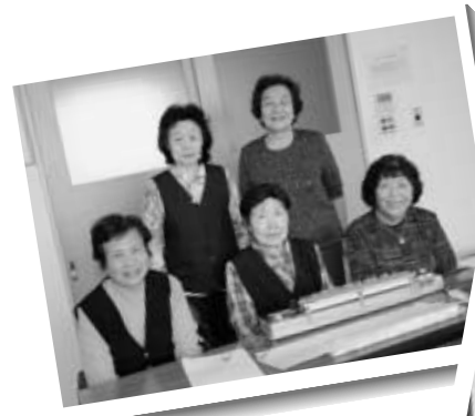
大正琴のメンバーと