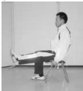
②ひざ伸ばし ゆっくりと片足のひざを伸ばします

最初は1日数回からはじめ、自己のペースで、20回くらいまで回数を増やします。鍛えたい部分に意識を集中しておこなうのがポイントです。