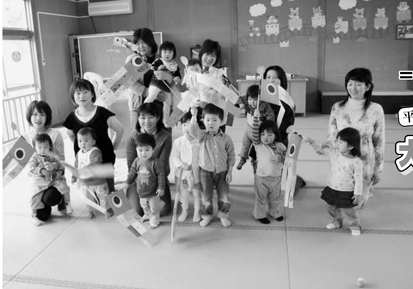
たくさんの子育て中の親子が訪れるつどいの広場

5月5日から11日は児童福祉週間です。子どもを取り巻く環境は年々大きく変化しているといわれています。子どもを健やかに育てるために家庭だけでなく、学校や地域全体での子育てへの役割も大切になってきています。