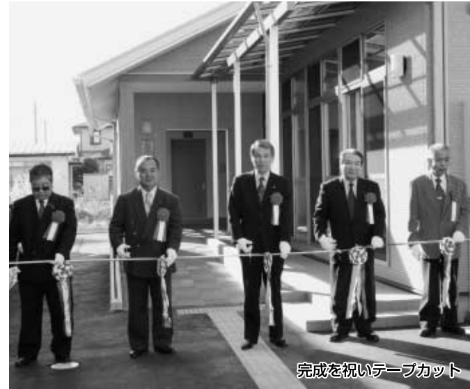
完成を祝いテープカット