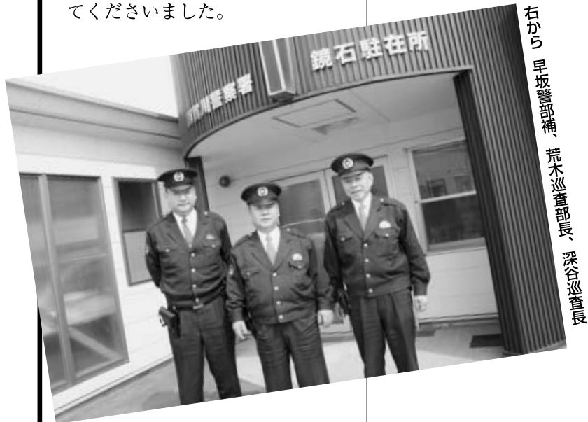
右から 早坂警部補、荒木巡查部長、深谷巡查長

式終了後は、消防団幹部や消防署員が、新入団員には基本動作の訓練を、一般団員には、規律訓練や放水訓練、救急手当を指導しました。