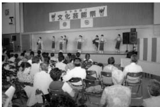
文化芸能祭(第3回あやめ祭りから)