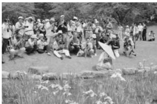
あやめ撮影会(第3回あやめ祭りから)

め株式会社による、あやめの株のプレゼントなどさまざまなイベントが催されるほか、地元特産品を販売する出店などが開催されます。町民のみならず、ご家族連れでぜひご来場ください。○問い合わせ先 町観光協会(町産業課内) ☎62-2118