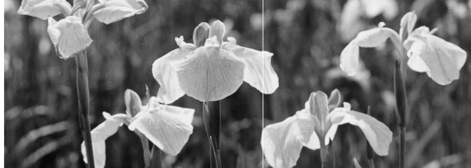
たくさんの美しいあやめが咲き競います