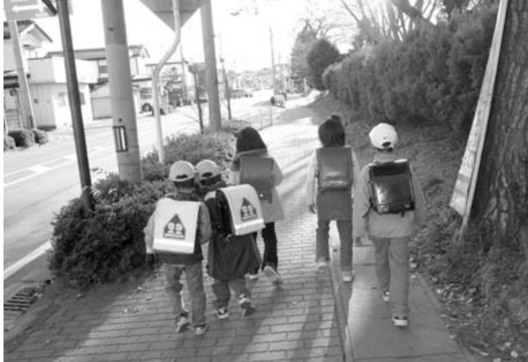
登下校時には、事件・事故にあわないように注意しましょう

安全といわれ続けてきた日本ですが、近年、犯罪の件数が増え続けています。また、社会を反映し、交通事故の起きない日はないほど。自分では大丈夫と思っても、犯罪や事故は、いつ自分の身にふりかか