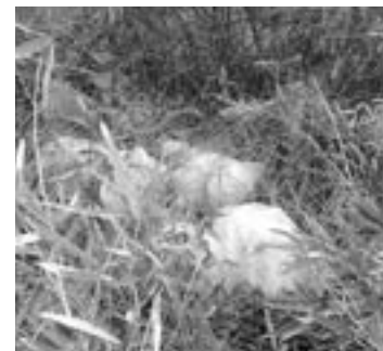
きれいな自然を守ろうね!

ごみは、決められたルールを守り指定された場所に出すようご協力ください。 なお、町民の方で不審者を見つけた方は次の所へご連絡ください。 ◆問い合わせ先 町健康福祉課 62-2115