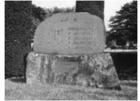
「牧場の朝歌碑建立20年感謝の集い」

昭和58年11月27日、鳥見山公園に建立された「牧場の朝」の歌碑は今年で20年目を迎えます。