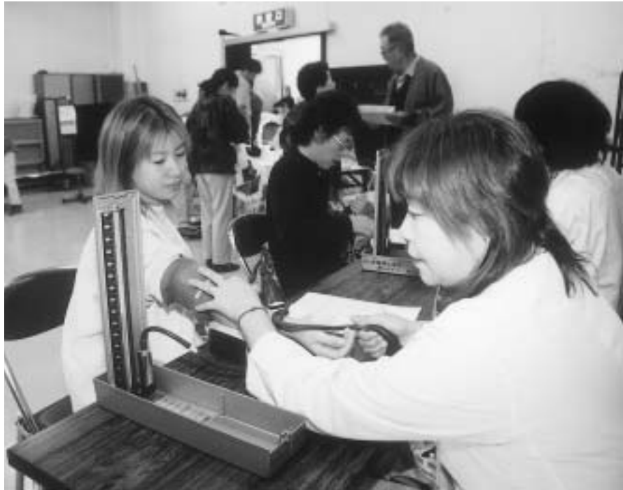
血圧測定をする受診者(昨年度の健康診査から)

日本人の死因の多くを占めるがん・心筋梗塞・脳卒中などの発症には、運動不足、偏った食事や喫煙・お酒の飲み過ぎなどの生活習慣が深く関わっています。健康な毎日を送るためには、生活習慣の改善による「予防」と健診による「早期発見」が重要となります。町では、9月24日(水)から10月10日(金)までの間、下表の日程により各地区において総合健康診査を実施します。対象となる方は、実施日を確認して忘れずに受診し、自分や家族の健康管理に活用しましょう。