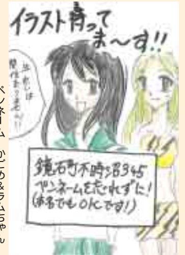
ペンネーム かこめ&ラムちゃん