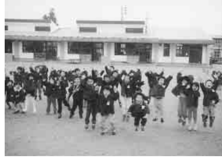
園児がはだして芝生の園庭をかけ回る姿ももうすぐです