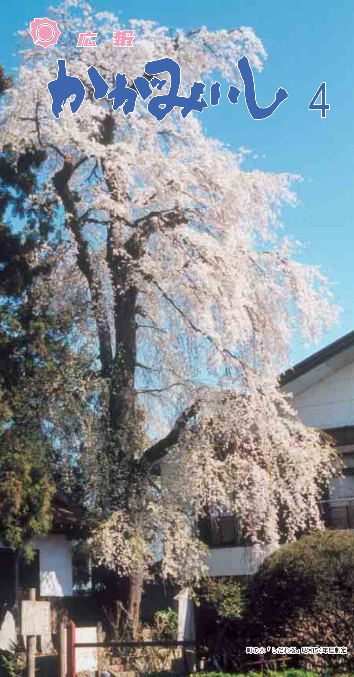
町の木「しだれ桜」昭和54年度制定