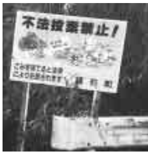
不法投棄は5年以下の懲役または1千万円以下の罰金に処せられます

町保健委員会では、「美しい町づくり推進」の一環としてあらま隊をシンボルとしたポイ捨てをしない、させない、拾おうキャンペーンを展開します。年齢、性別、組織を問わず、「三つの誓い」をただでなくてもあらま隊員として活動できますからぜひご応募ください。 「あらま隊」とは、杜の都「仙台市」で生まれたアレマ隊と目的が同じものです。 応募方法 あらま隊本部(保健福祉課内)の参加申込書により申し込む 活動と参加内容 個人や団体で実施する清掃活動を自分の都合のよいときに実施して調査結果を本部に提出 問い合わせ先 あらま隊本部(保健福祉課内) (62)2115 FAX(62)6019