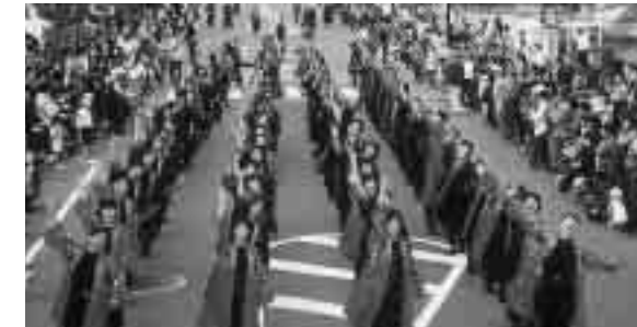
明るく元気な町をみんなで作りましたよ( YOSAKOI祭りより)

介護保険事業では、要介護 者等が自立した生活を営める よう、居宅介護支援や住宅改 修など介護サービスの充実に 努めます。障害者福祉事業に ついては、四月より障害者福 祉サービスが「措置制度」か ら「支援費制度」に移行され、 利用者のニーズに的確に対応 し、福祉サービスの向上も図 られます。