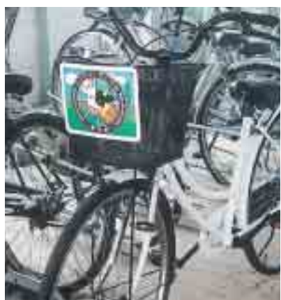
レンタルサイクルには「モーたん」プレート装着

後八時まで(当日返却) 貸出場所 鏡石駅前駐輪場 利用方法 申込書に記入し て貸出証の交付を受ける 利用台数 十台 問い合わせ先 町総務課 (62)2111