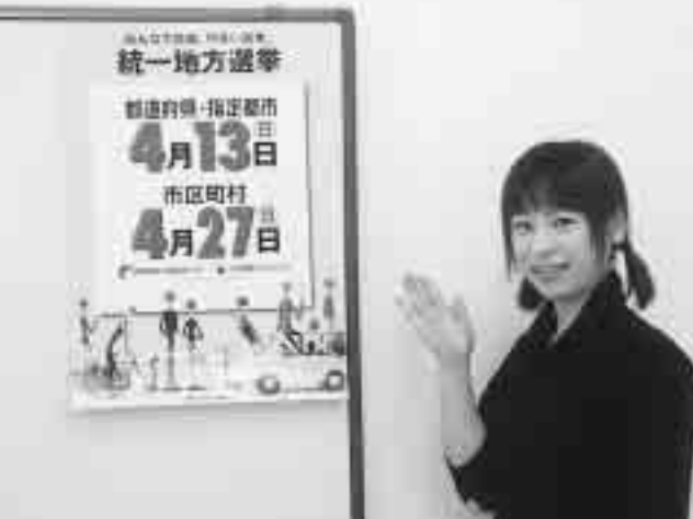
大切な一票を忘れないで投票しましょう

身体に重度の障害があるために投票所に行くことができない方は、郵便による投票ができます。その場合、「郵便投票証明書」が必要ですので前もって申請手続きを行ってください。 問い合わせ先 鏡石町選挙管理委員会(町役場総務課内) (62)2111