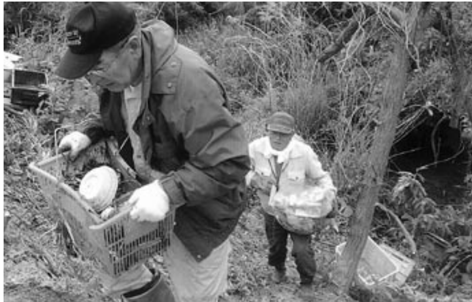
大量のごみを片付ける参加者

い場所なのに、一歩土手を降りると、大量のごみが散乱していました。約2時間の作業で、燃えるごみ10袋をはじめ、燃えないごみ、ペットボトル、空き缶、粗大ごみなど軽トラック5台分を回収しました。