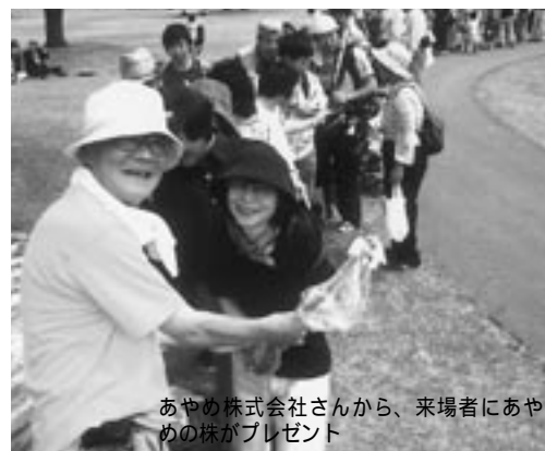
あやめ株式会社さんから、来場者にあやめの株がプレゼント