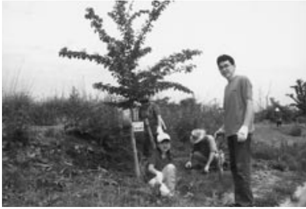
汗を流しながら除草作業に精を出す桜のオーナーのみなさん

当日は、約70人のオーナーが参加し、強い日差しが照りつけるなか、草刈機やカマなどを使って自分の苗木の周辺を除草しました。