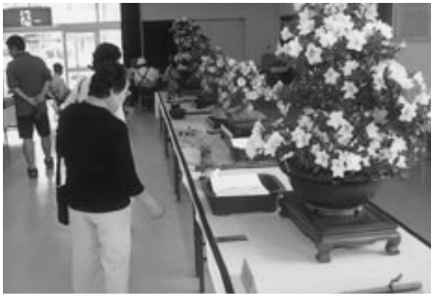
多くの方が、見事な作品に見とれていました

展示部門には、サツキや生け花、俳句、書道など約250点が並び、訪れたみなさんの目を楽しませました。