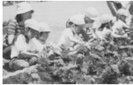
鳥見山公園内の花壇にマリーゴールドを植える園児たち