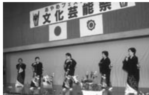
鳥見山体育館のステージでは踊りなどが披露されました(文化芸能祭)