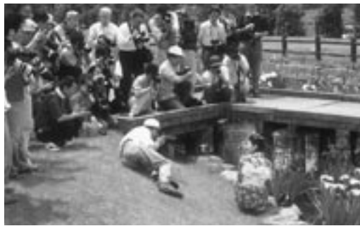
たくさんカメラマンが参加した「あやめ撮影会」