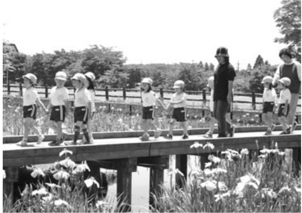
満開の「あやめ」が咲く鳥見山公園

町がフローア花の女神(のまちづくり事業の一つとして町花「あやめ」の普及を目的に実施している「あやめフェスティバル」が6月14日(月)から20日(日)までの一週間、鳥見山公園で開催されました。期間中は、好天に恵まれたこともあり、多くの観光客が訪れました。特に最終日の20日には、文化芸能祭、「ガーデンニング講演会」など多くのイベントが行われ会場を訪れた人々を楽しませていました。