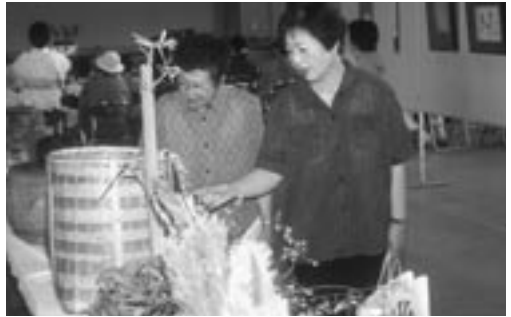
多くの作品が展示され、来場者の目を楽しませていました