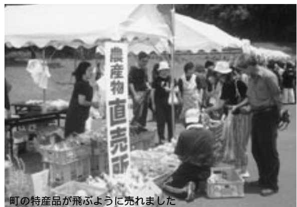
町の特産品が飛びように売れました