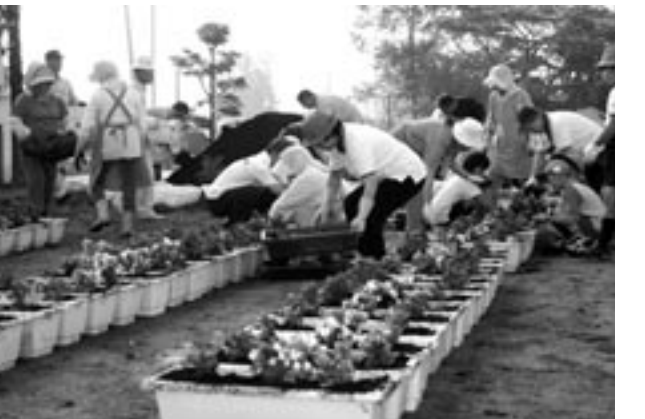
早朝からお疲れさまでした

参加者は、約20cmほどに育ったペコニアやサルビアを約200プランターに定植し、町内の各公共施設に配りました。今後、これらの花が町民のみなさんの目を楽しませてくれるでしょう。