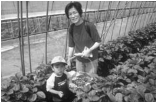
採れたてのイチゴおいしそうですね

もぎたてのイチゴを口にした、参加者からは「あまいね」「おいしいね」などの歓声があがっていました。