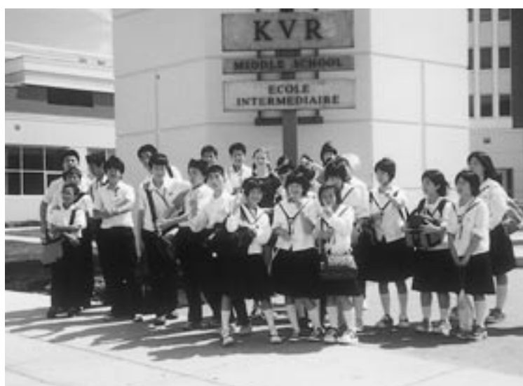
平成14年にカナダを訪れた団員のみなさん