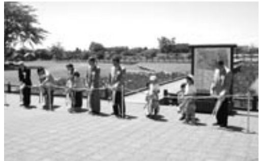
オープニングセレモニー(6/14)