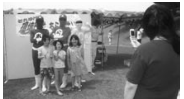
環境戦隊「あらま隊」も大活躍