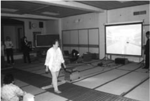
室内につくった横断歩道、うまく渡れたかな

お年寄りの方々は、車の接近速度と見た目のギャップや、自らの横断速度に認識を新たにしていました。