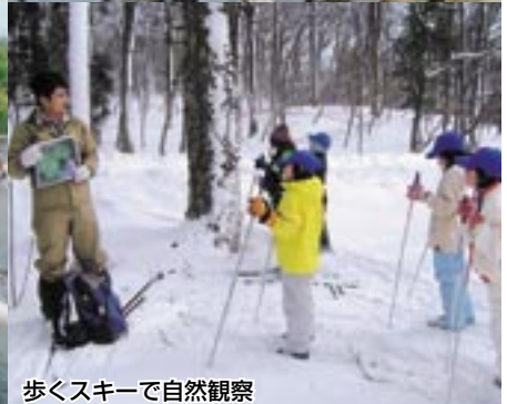
歩くスキーで自然観察