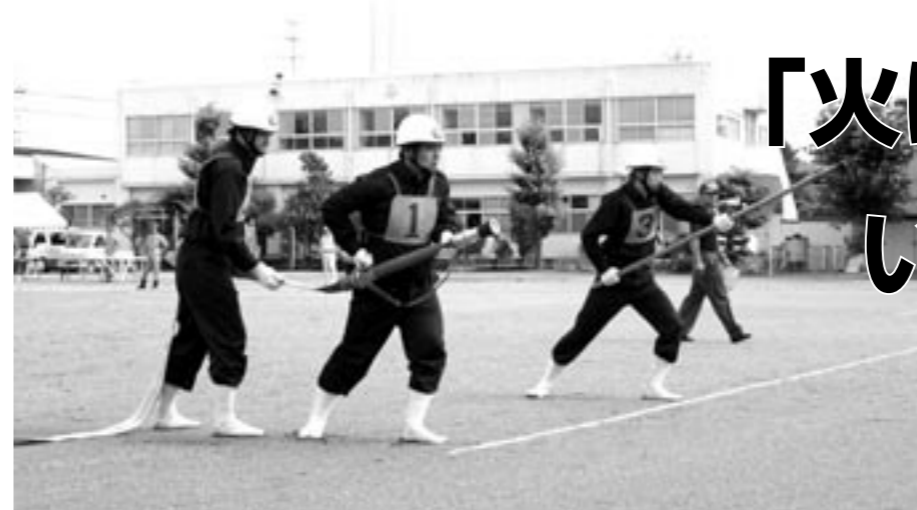
地域を災害から守る消防団員