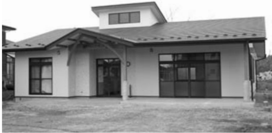
完成間近の旭町コミュニティセンター

旭町区に区民待望の集会所「旭町コミュニティセンター（仮称）」が間もなく完成します。この集会所は、以前の旭町公民館が老朽化と手狭となったことから陳情が出され、町の公共施設整備計画の中でようやく完成の運びとなったものです。引き渡し後は、地域コミュニティ活動の拠点として大いに活用され、地域の元気づくり役に役立つことが期待されています。