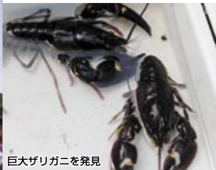
巨大ザリガニを発見