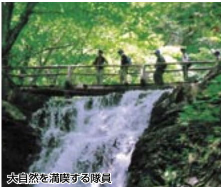
大自然を満喫する隊員