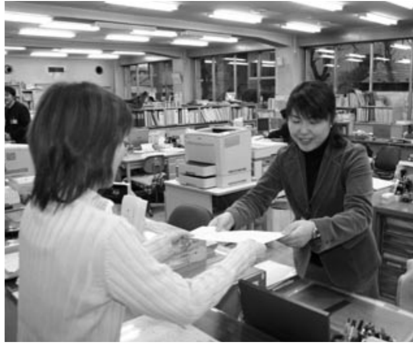
窓口での手続きは忘れずに

3月・4月は進学や就職そして転勤などで1年のうちでも住所の異動が多い時期です。住所が変わったときは必ず役場税務市民課の窓口で住所異動の届出をしてください。鏡石町から引っ越されるみなさん、ほかの市町村から引っ越してきたみなさん、住所の異動届はお済でしょうか。今月号では、住所異動の手続きについてご案内します。