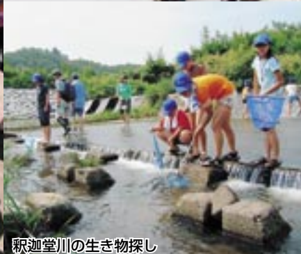
釈迦堂川の生き物探し