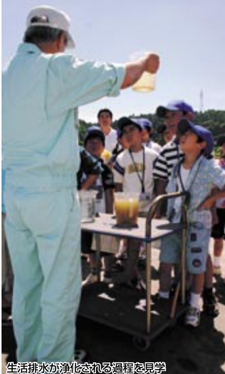
生活排水が浄化される過程を見学