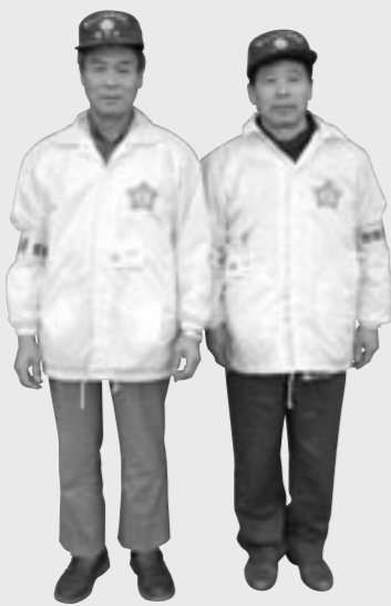
街頭パトロールで活躍中の地域安全活動推進員のみなさん

現在、町で、車上ねらいなどの被害が後を絶たないことから、鳥見山公園や図書館などの公共施設を中心にパトロールを行っています。しかし、パトロールをしてみると、