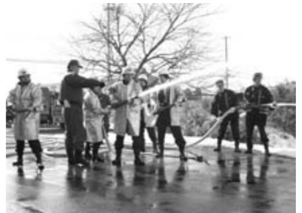
一斉放水する団員のみなさん

町消防団では、春の全国火災予防運動期間中の、3月6日(日)午前8時30分から模擬火災訓練を実施しました。 訓練は、笠石農村婦人の家から建物火災が発生したという想定で実施され、団員150名が参加しました。 消防団員のみなさんは、訓練開始の合図と共にそれぞれの持ち場に分散し、火災発生現場に向けて真剣な表情で放水を行いました。 会場には、近所の住民が多数訪れ、消防団員に大きな声援を送っていました。