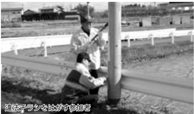
違法チラシをはがす参加者

町の安全のため活躍しているみなさんの活動内容や防犯対策などについてお知らせするコーナーです。今月号では、先日行われた違法チラシ撤去作業についてお知らせいたします。