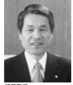
鏡石町長 木 賊 政 雄

現に向け、「快適空間づくり」、「元気づくり」、「活力づくり」、「入づくり」、「地域づくり」の5つの柱を基軸に各種事業の重点的かつ効果的配分に努め、一般会計予算の総額では、39億8,000万円と前年度に比べ4.6%、1億9,000万円の減額予算となりました。 歳入面については、国の三位一体改革により、地方交付