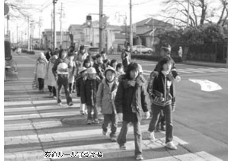
交通ルール守ろうね