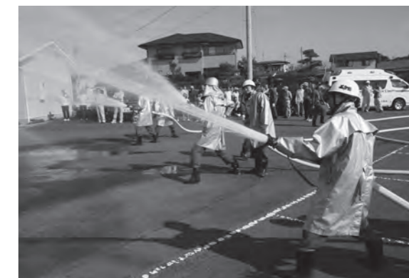
消防団による中継放水訓練の様子

訓練には町消防団、女性消防隊、8分団消防活動支援隊及び関係者約100人と高久田区民約40人の計140人が参加しました。訓練では、消防団による中継放水訓練、地区住民による初期消火訓練・一般救急法講習会が行われ、参加者は災害時に円滑かつ的確に対応できるように、真剣に訓練に取り組みました。