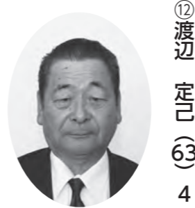
議長、総務文教委員