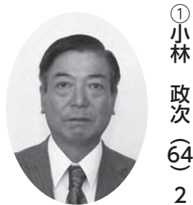
副議長、産業厚生委員 議会運営委員、広報委員長

▼議員の皆さんを紹介します。任期は平成27年9月4日～平成31年9月3日までです。議席番号順となっております。○は議席番号。( )は年齢、( )の下の数字は当選回数です。