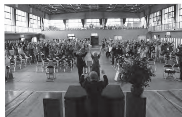
参加者全員で万歳三唱！