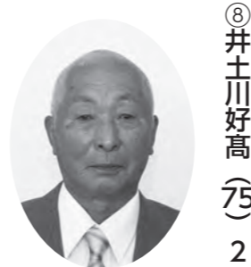
産業厚生委員 町監査委員