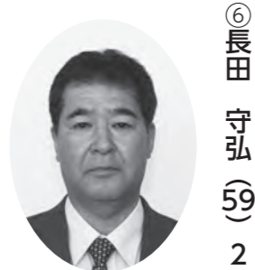
産業厚生委員長 議会運営委員、広報委員