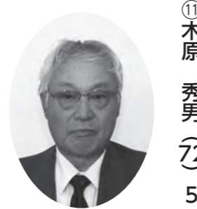
産業厚生副委員長 議会運営委員、広報副委員長