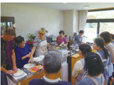
岩瀬牧場オランダフェア「オランダ料理教室」