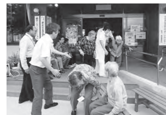
火災の際の避難の仕方を確認

この日のために、一生懸命練習してきた園児達は練習の成果を発揮し、笑顔いっぱい全力でゴールを目指し頑張りました。競技には保護者や先生も参加し、園児とともに一番目指して奮闘しました。紅組も白組も素晴らしい頑張りでしたが、結果は白組の優勝となりました。