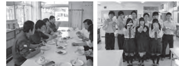
今年は「ホットドック」と「アイスバーガー」販売します！

商品の特征として、パン・ソーセージ・アイスとほとんどの具材を本校生が製造したものであり、2商品とも100食ずつ準備する予定です。コーヒーとセットで300円で販売しますので、是非ご購入ください。