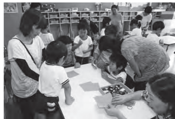
おじいちゃん、おばあちゃん一緒に遊ぼう♪

9月4日鏡石幼稚園において、祖父母交流会が開催されました。各組ごとに普段は幼稚園と一緒に遊ぶことのできないおじいちゃん、おばあちゃんと室内で駒や折り紙を、外では遊具や紙飛行機を飛ばして一緒に楽しいひとときを過ごしました。最後は園児全員でダンスを披露し、手作りのサプライズプレゼントを渡しました。