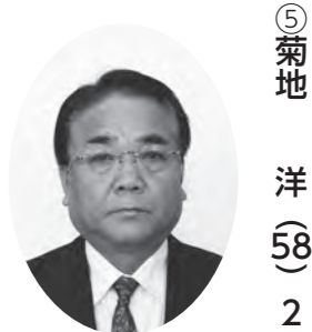
総務文教委員長 議会運営副委員長、広報委員