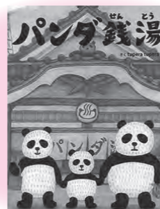
「パンダ銭湯」 絵本館 tupera tupera : 作

パンダの親子が3匹でやってきたのは、パンダ銭湯（パンダ以外の入店はお断り）です。料金を払って、服をぬいだらカゴにいれて・・・いえ、ちょっと待って！パンダのあの白黒は、なんと、模様ではなかった！？不思議でおかしいパンダのお風呂屋さん、今日も大繁盛です。パンダの秘密がわかる一冊。