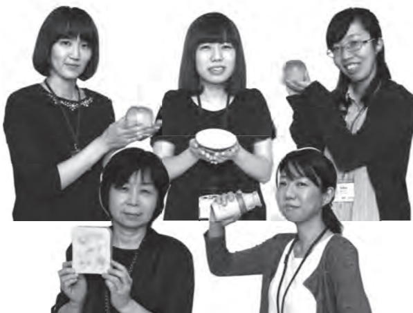
私たち保健師・栄養士が訪問してお話を伺います!