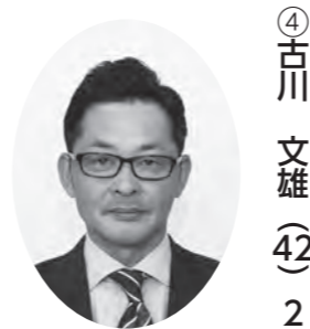
総務文教副委員長 議会運営委員長、広報委員