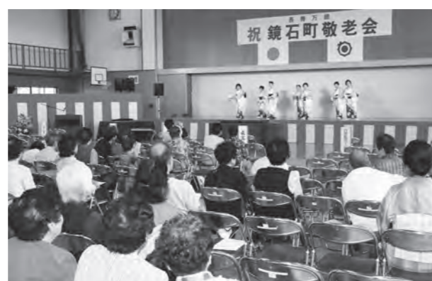
アトラクション演目・舞踊「玉杯の舞」