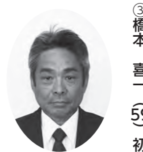
総務文教委員 議会運営委員、広報委員