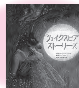
「シェイクスピア ストーリーズ」 BL出版 アンドリュー・マッシュェス：文 アンジェラ・バレット：絵 島武子・島玲子：訳

パンダの親子が3匹でやってきたのは、パンダ銭湯（パンダ以外の入店はお断り）です。料金を払って、服をぬいだらカゴにいれて・・・いえ、ちょっと待って！パンダのあの白黒は、なんと、模様ではなかった！？不思議でおかしいパンダのお風呂屋さん、今日も大繁盛です。パンダの秘密がわかる一冊。