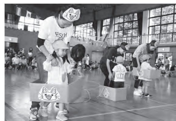
ゴール目指してお母さんと一緒に走ります！