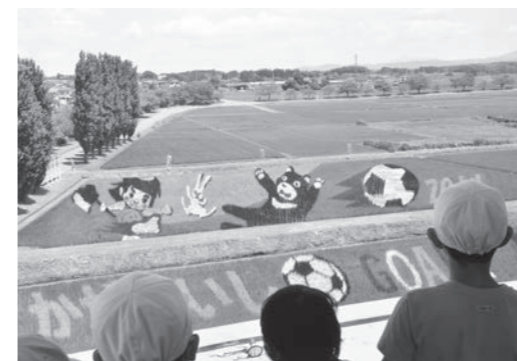
◀図書館の窓から眺める子ども達

唱歌「牧場の朝」のモデルとなった岩瀬牧場の「牧場の風景」。2年目は鬼退治に向かう「桃太郎」。3年目はワールドカップの年ということ事で、サッカーをする「金太郎」。4年目となる昨年は、町の公式キャラクター「牧場のあーさー」が乙姫に扮した「浦島太郎」でした。そして5年目の今年は、月に帰る「かぐや姫」となりました。 鏡石町の施設で一番高いのが町の図書館です。その図書館の4階から眺める「田んぼアート」は、まさに「窓から眺める絵本」のようです。