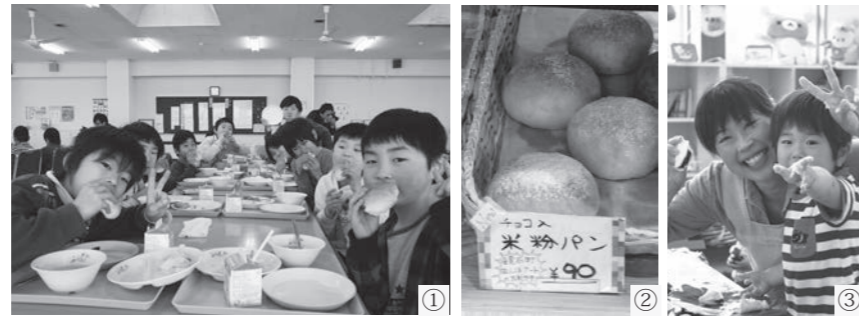
①学校給食で米粉パンを食べる町立第二小学校の児童たち ②町内のパン屋さんで商品化された米粉パン ③親子で「かしわ餅」作りを行った親子クッキング教室

田んぼアートで採れた「天のつぶ」は田んぼアート米として、また、米粉に加工して米粉パンとして小中学校の給食で振る舞われました。その他、米粉は「かしわ餅」などに应用され、米粉パンは商品化もされるなど、様々な活用がされており、今後も新たな展開が期待されます。