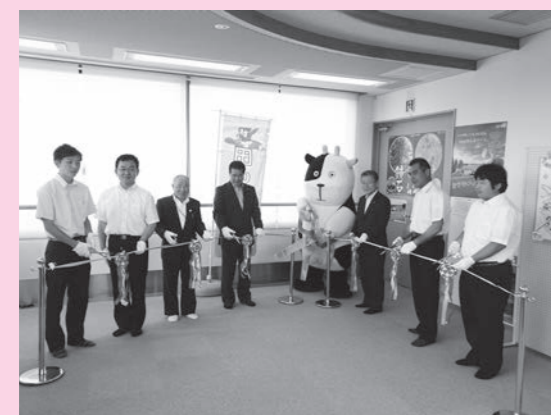
◀オープニングセレモニーでの テープカットの様子

6月14日(火)、観覧場所である町図書館の4階で、一般観覧の「オープニングセレモニー」が行われました。 植えられた田んぼアートは稲の成長にあわせて徐々に鮮明になっていき、7月中旬に見頃を迎えます。 昨年2万人を超えた来場者は今年何人になるのか、今年はどういうような新たな展開を見せてくれるのか、とても楽しみです。 鏡石町の「田んぼアート」は、まだまだ「進化」し続けます。