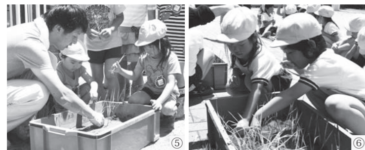
⑤鏡石保育所、⑥鏡石幼稚園での田植え体験の様子

町内の幼稚園・保育所では、田んぼアートで使われている苗を使用して田植え体験が行われています。園児たちは泥の感触に最初はとまどいながらも、田植えを楽しみました。普段自分たちが食べているお米がどのように作られるのかを学ぶことで、食育にも繋がっています。