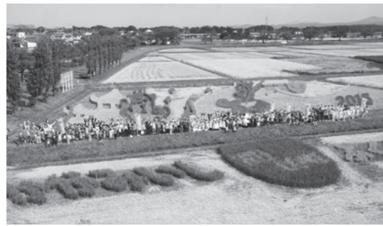
昨年の稲刈り祭りで作った3D田んぼアート