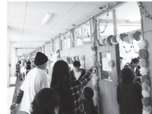
クラス展示の様子

◆平成28年度 力農祭 10月29日(土)～31日(月) 3年に1度の文化祭である「力農祭」が開催されました。一般公開では、クラス・各科による展示、生産物の販売、模擬店等が行われ、来校者数は2千人を超える大盛況に終わりました!