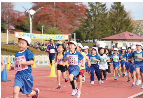
第11回鏡石駅伝・ロードレースで走る小学校児童たち