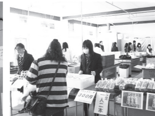
食品科学科による販売

◆平成28年度 収穫祭 10月31日(月) 収穫祭は本年度の農場実習を振り返り、勤労の尊さと収穫の喜びを味わい、生きる力を育むことを目的に行われ、全校生が参加し各班ごとに鉄板で調理を行いました。