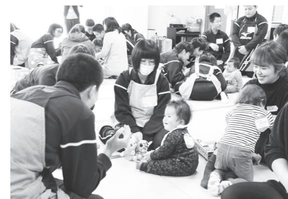
「いないいないばあ〜」で幼児をあやす生徒(左)

参加した生徒の皆さんは、保護者の方から育児の大変さや子育ての喜びなどについて話を聞いたり、実際に幼児とふれあったりしながら、子育てや家族、家庭について関心を深めていました。慣れない幼児とのふれあいに最初は緊張していた生徒の皆さんも、徐々に慣れ、楽しくふれあっていました。