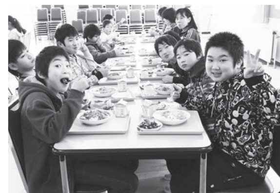
「天のつぶ」を使用したカレーを頬張る二小の児童たち

児童の皆さんは「とてもおいしいです」「田んぼアートのお米を食べることができて嬉しいです」と、喜びを感じながらおいしくいただいていた。