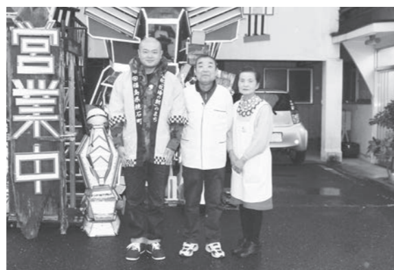
プレートの前で記念撮影