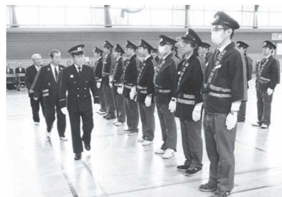
姿勢を正して通常点検を受ける団員