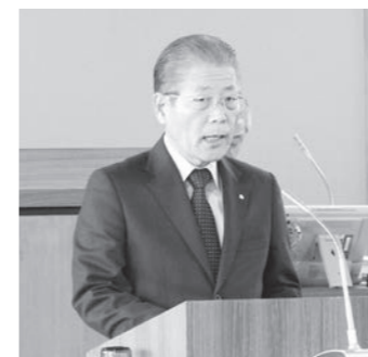
予算編成の方針を述べる遠藤町長

平成29年度各会計当初予算は、3月6日(月)から17日(金)まで開催された3月町議会定例会で可決され、成立しました。 一般会計当初予算は、59億5,500万円という、前年度比1億5,500万円、2.7%増の予算となりました。今月号では一般会計を中心としての中身を紹介します。