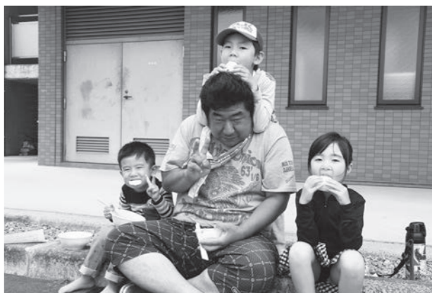
田植え後の豚汁とおにぎりおいしいね♪