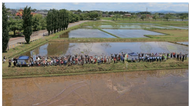
豊作祈願田植え祭り後に全員で集合写真！

広報担当のつぶやき 今月号では町花「あやめ」を取り上げました。調べていく中で、あやめの見分け方など知らなかった部分も多く、私自身とても勉強になりました。漫然と鑑賞するだけでなく、見分けながら鑑賞することで新たな楽しみ方もできるのではないかなと思います。 豊作祈願田植え祭りでは、子どもたちが泥んこになりながら、楽しく田植えをしている姿が印象に残りました。 今月の1ショット