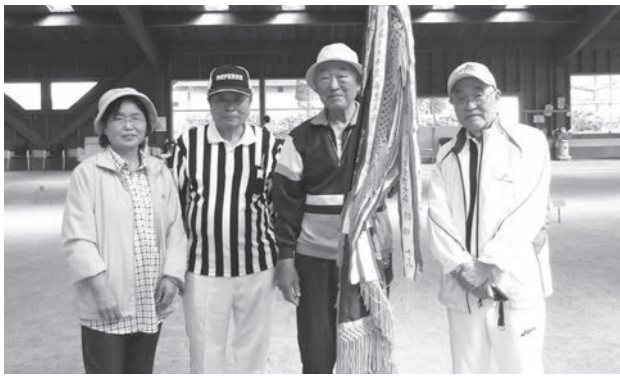
優勝したさかいチーム