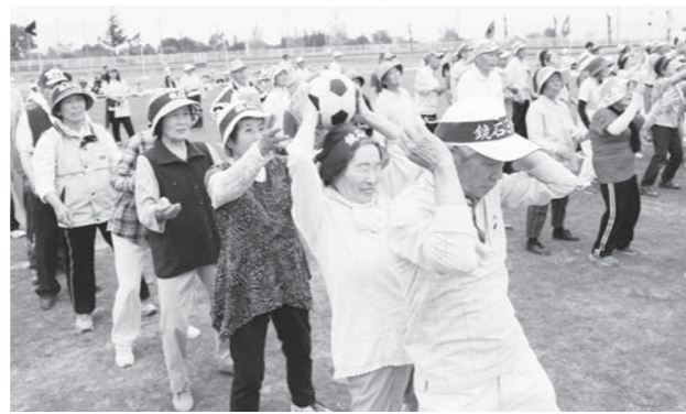
ボール送り競争に取り組む参加者

優勝は豊郷豊寿会、準優勝はさかい寿会、3位が旭町旭寿会、4位が久来石松亀会でした。参加者は元気いっぱい競技を楽しんでいました。