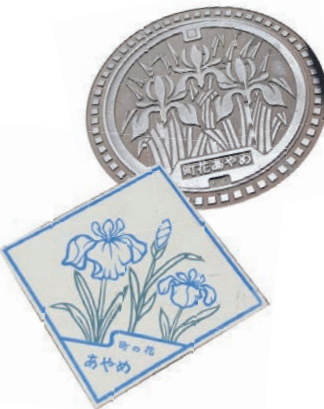
歩道のタイルやマンホールにも描かれています。

今月号では、その町花「あやめ」について、鳥見山公園内の主な観覧場所や見分け方、関連のイベントについてご紹介します。