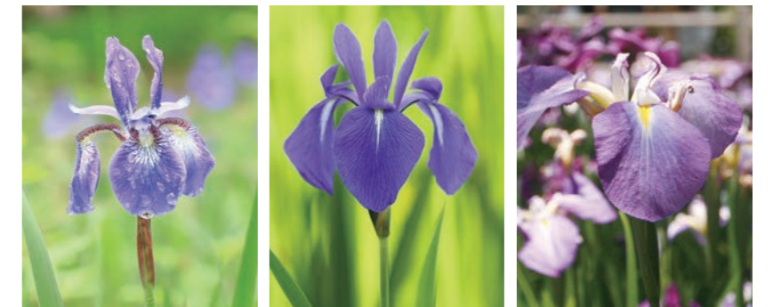
[アヤメ (かっこばな)]

町花として選定された当時の花は、アヤメの中でも「かっこばな」と呼ばれる品種で、公園内では主に自然林の遊歩道沿いに自生しています。現在ではこれら3種類を総称した「あやめ」を町花としてPRし、鳥見山公園のあやめ園には、背丈が高く、見栄えがよい「ハナショウブ」が多く植えられています。