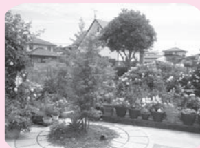
平成28年度最優秀賞作品