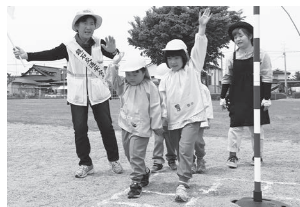
ミニ信号機を使って学ぶ鏡石幼稚園の子どもたち