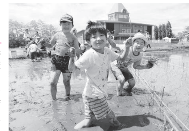
泥んこになりながら田植え頑張りました

6月より、成長していく田んぼアートの様子を町図書館4階展望台からご覧いただけます。