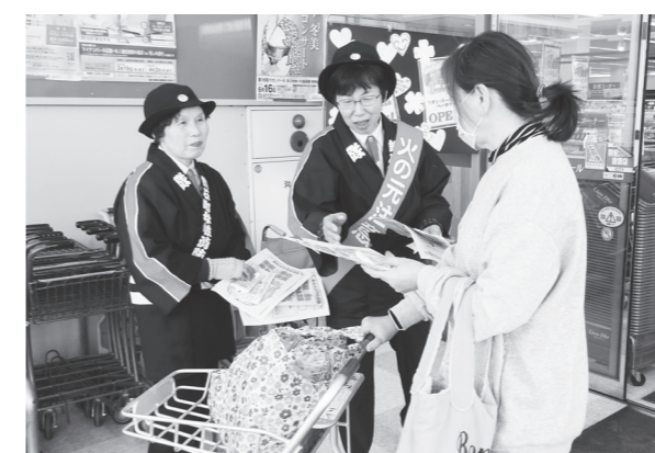
来店者に火災予防を呼びかける隊員

講座は、地域のサロンに積極的に協力するボランティアを養成することを目的に年間6回開催され、全講座を受講した方はボランティアとして登録されます。今回の講座では、「簡単にできる工作レク」として紙飛行機やフェスターを和気あいあいと作成していました。