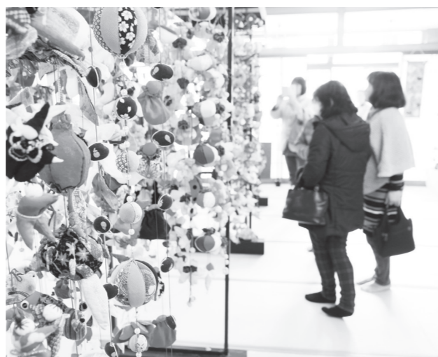
多くの来場者が訪れ色とりどりの作品を楽しみました

玄関では、約4mのヤマボウシの木に飾られた花や毬、小鳥など多様な吊るし飾りが来場者を迎えたほか、会場全体が愛らしい飾りで埋め尽くされ、華やかな雰囲気に包まれていました。飾られた作品は、東日本大震災後、復興を願って1つひとつ作り続けてきたもので、3000点を超える作品が展示されました。