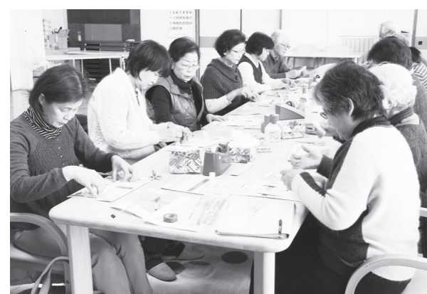
紙飛行機の工作に取り組む受講者