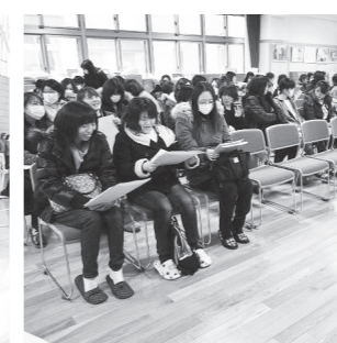
新入学児童保護者説明会