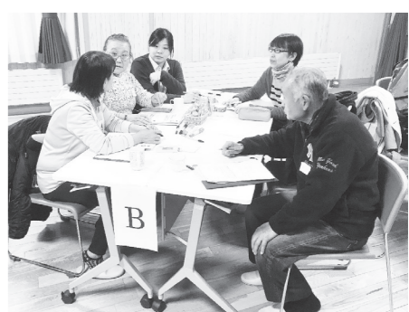
まちづくり勉強会の様子