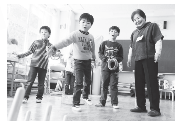
名人と一緒に輪投げを楽しむ子どもたち

授業では、凧揚げや折り紙、あやとりなど昔ながらの遊び5種目が準備され、子供たちは、昔遊びの名人たちに手ほどきを受けながら懐かしい遊びを楽しみました。