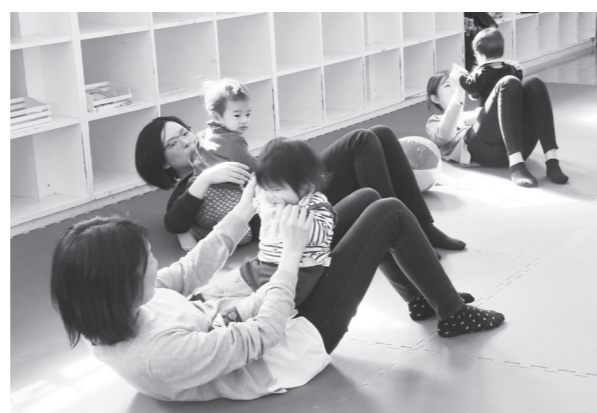
マッサージでふれあう参加者

教室は、親子でのマッサージやリズムに合わせて体を動かすことで、親子のふれあいを深め、健康づくりに役立てることを目的に開催されました。エアロビクスインストラクターを講師に迎え、参加者はタッチングやストレッチなどを通し、お子さんとふれあいながら一緒に楽しんでいました。