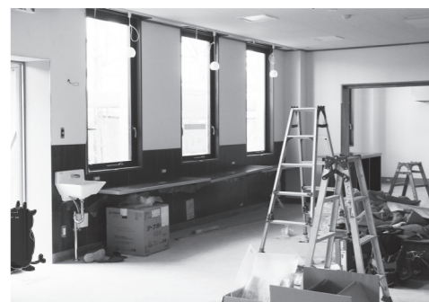
改修が進むかんかてらす

本町の観光・交流の拠点、そして、まちなかの賑わい創出を目的に昨年9月末から進めてきた「鏡石まちの駅かんかてらす設置工事」が今月末に完成し、リニューアルされた駅舎が間もなくお目見えします。 この工事は、JR東北本線鏡石駅の駅舎を兼ねて昭和61年5月にオープンした町コミュニティセンターの1階部分を改修するもので、駅の待合機能をはじめ、農産物や特産品の販売、軽食・飲み物を提供するカフェ、売り場を貸し出すチャレンジショップ、菓子製造室、レンタルキッチンなどが整備されています。