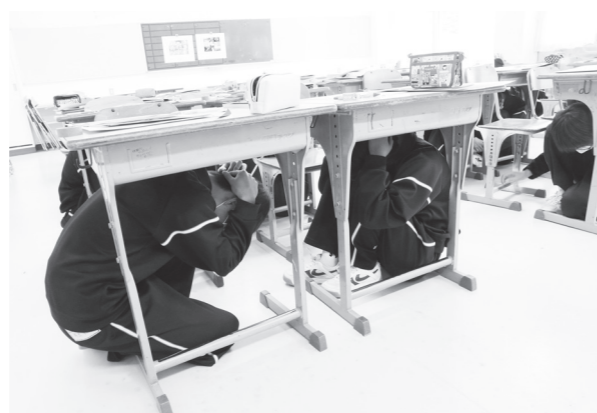
鏡石中学校での訓練の様子

訓練は、県内で震度6クラスの地震が発生したことを想定し、それぞれが訓練時刻にいる場所で行われ、安全確保行動訓練として3つの行動「まず低く、頭を守り、動かない」を1分間行いました。その他、プラスワン訓練として、危険個所の点検や非常時の連絡体制の確認など、それぞれができる範囲で防災に関する取組を実施しました。