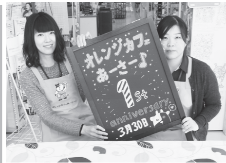
お気軽にお越しください♪

今回の オレンジカフェ あーさー♪ 【日時】 3月30日(金) 10時～12時 【場所】 ウエルシア岩瀬鏡石店