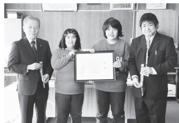
報告に訪れたライジング・サンの方