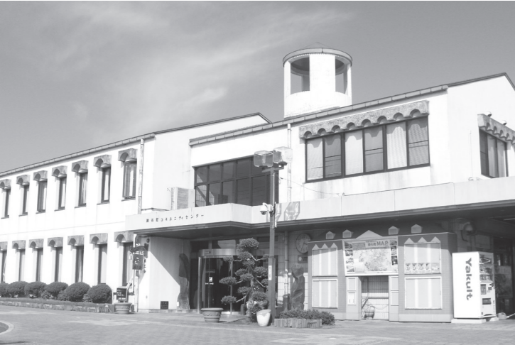
今月末にはリニューアルされた建物が完成