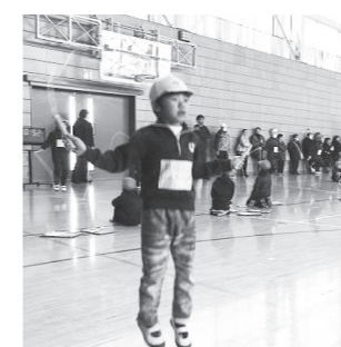
なわとび記録会（1年）

1年生をかわきりに、各学年の「なわとび記録会」を実施しました。1年生の「なわとび記録会」では、30名程度の保護者・祖父母の皆様にご来校いただき、子どもたちのとんだ回数を数えていただきました。皆さんの声援も心強く、子どもたちは、練習の成果を十分に発揮できたようでした。2月6日(火)には、来年度本校に入学を予定している91名の保護者の皆様をお迎えして、「新入学児童保護者説明会」を実施しました。学校の担当者からの「1年生の学校生活」についての話を熱心に聞き入っていました。来年度の1年生は、4学級編制の予定です。入学をお待ちしています。