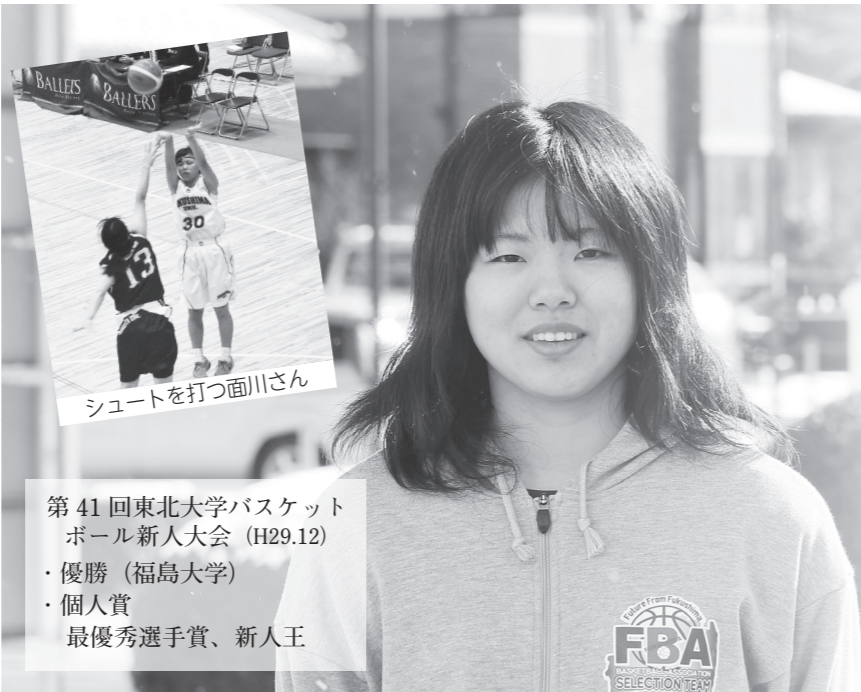
第41回東北大学バスケットボール新人大会 (H29.12) ・優勝 (福島大学) ・個人賞 最優秀選手賞、新人王