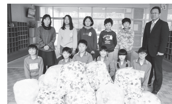
たくさんのエコキャップが集まりました

社会のために、人のために、本校ではこれからも、エコキャップ運動に取り組んでまいります。