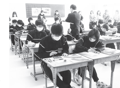
美術の授業参観の様子

学年懇談会では、子どもたちの学習や生活の様子に加えて1・2学年は修学旅行の計画、3学年は進路や卒業式についての話がありました。さらに今回は、福島県の子どもの学力向上のために、家庭学習の進め方やその支援の仕方についてまとめた手引き、『家庭学習スタンダード』（福島県教育委員会発行）についての説明もありました。