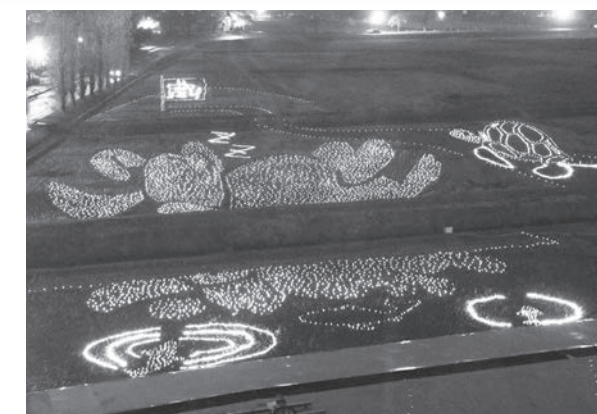
LED装置ペットボトルで浮かび上がった「うさぎとかめ」

11月3日(土)図書館北側の水田で、かがみいし田んぼアート実行委員会による「田んぼアートイルミネーション〜きらきらアート〜」製作のための「希望の苗」田植えイベントが開催され、約80人が参加しLED装置「ペットボトル」約7,000個を設置しました。11月9日(金)にはお披露目式が行われ、参加者は夜の水田に美しく浮かび上がる「うさぎとかめ」に歓声を上げていました。