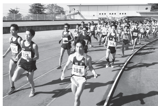
一斉にスタートする一般男子の部

天候にも恵まれ、ランナーはそれぞれの自己ベストを目指して競技に臨みました。沿道では、保護者や友人など多くの応援者が声援を送っていました。