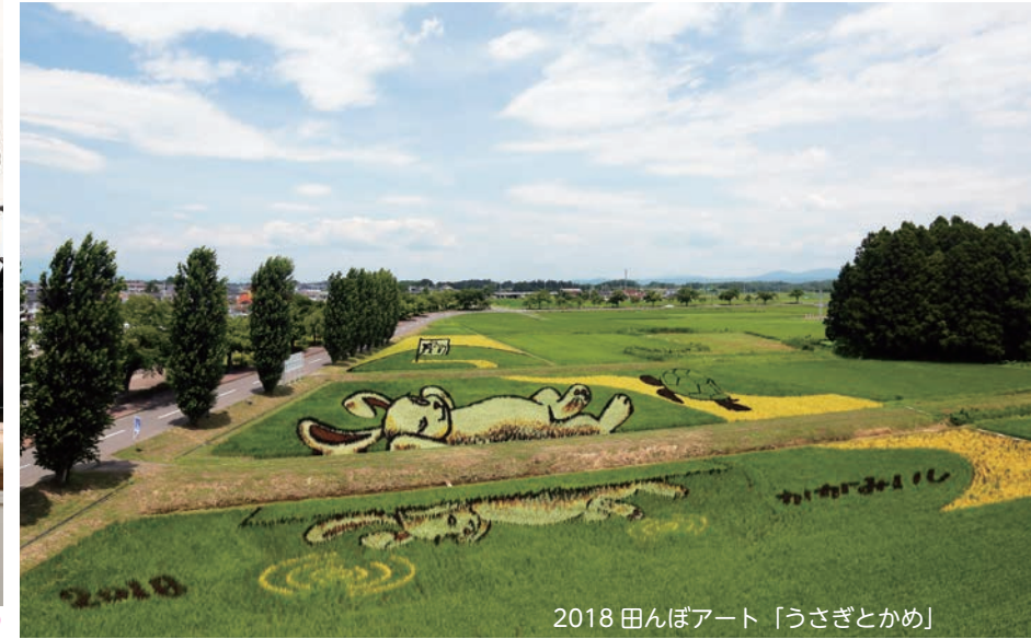
2018 田んぼアート「うさぎとかめ」