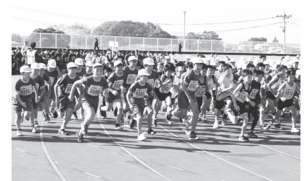
めざせ 自己ベスト更新 がんばれ まきばっ子

保護者の皆さま、地域の皆さま、スタンドや沿道からのたくさんの応援、本当にありがとうございました。