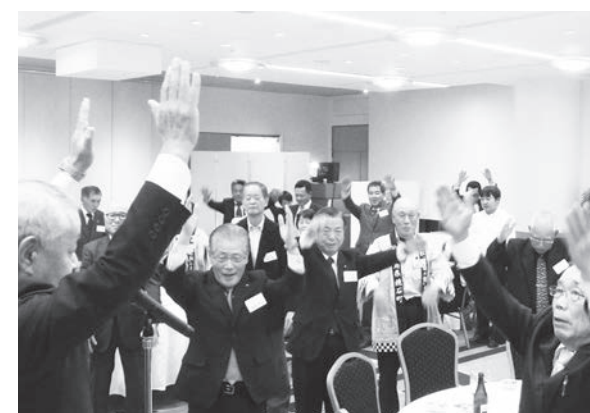
会の最後に全員で万歳三唱

10月27日(土)鏡石まちの駅「かんかんてらす」で、「秋の収穫祭」が開催されました。町産の新米や果物、野菜などの農産物、岩瀬農業高校のブルーベリーやりんごのジャム、パウンドケーキなどが販売されました。そのほか、玉ねぎやこんにやくの詰め放題や、新米の味比べ、豚汁の無料提供などのイベントがあり、多くの来場者で賑わっていました。