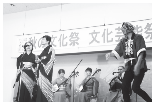
桜正会による民謡の発表

文化芸能祭には138名が参加し、舞踊、歌謡、コーラス、社交ダンスと様々な優れた演題が発表されました。展示部門では、子どもから大人までの909名による1276作品が展示され、書道、手芸、絵画、写真、園児児童生徒作品など力作ばかりで、訪れた人は素晴らしい作品の数々に見入っていました。