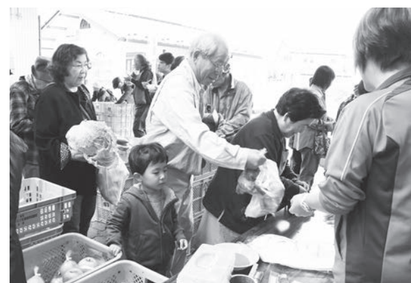
町産の野菜を買い求める来場者