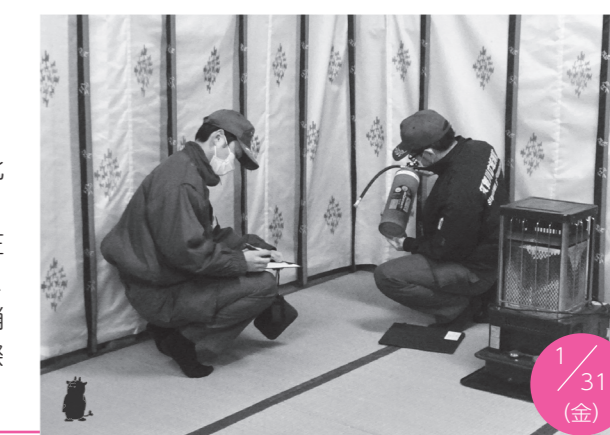
寺社内の消火器を確認する署員ら