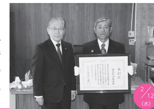
受賞報告に訪れた稲田団長(右)