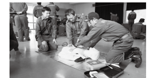
消防署員の指導を受け、心肺蘇生法の訓練に取り組みする消防団員

消防署は「常備消防」と呼ばれ、消火・救急・救助などの業務を職業として行います。消防団は「非常備消防」と呼ばれ、住民がボランティアで消火活動や水防活動、行方不明者の捜索など幅広い活動を行います。実際の火災現場では、消防署だけでは十分な消火が行えないことも多く、消防団が大きな役割を果たします。よく車の両輪に例えられ、互いの連携が必要不可欠なのです。