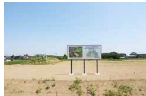
造成が進んでいる建設予定地 (駅東第1土地区画整理地内)