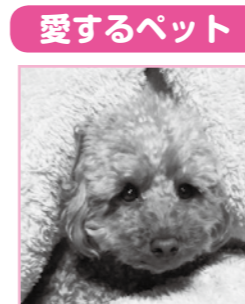
吉成 ななお (オス) (平成29年7月7日生まれ)