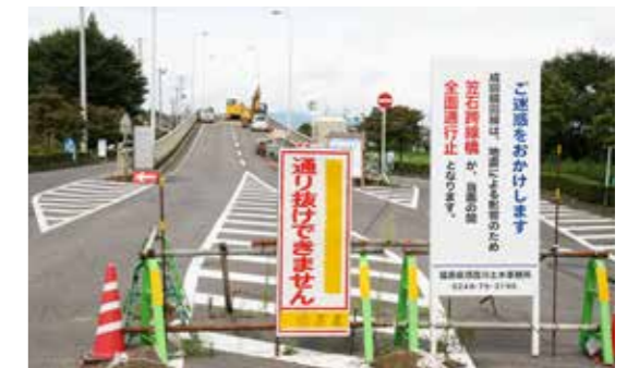
東日本大震災の影響で、長期間通行止めとなった県道成田鏡田線笠石跨線橋（平成23年8月撮影）

駅西側に位置する町庁舎や鏡石第一小学校を中心とした防災拠点のほかに、駅東側にも新たな防災拠点の整備が必要です。