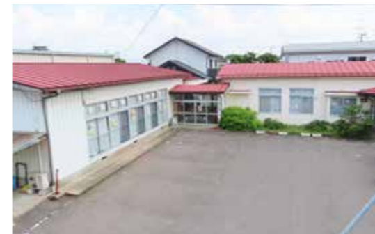
築58年が経過し、老朽化している町保健センター

町では現在、子育て支援、障がい者支援、高齢者支援を実施している保健センターや、社会福祉協議会、地域包括支援センター、ボランティアセンター等が分散しており、さらにそれらの施設が老朽化している状況にあります。