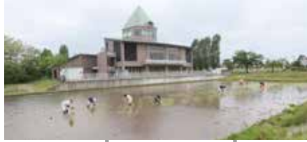
田植え作業の様子