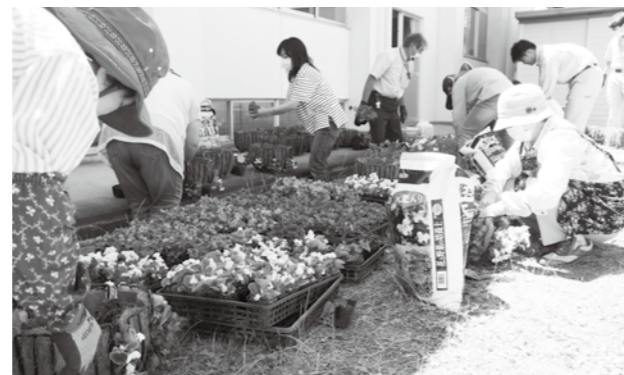
花のバスケット作りに取り組む受講者