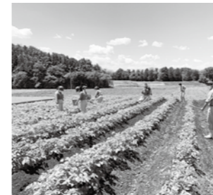
久しぶりの授業再開

これから授業や実習を通して、たくさんの知識や技術を習得してもらいたいと思います。