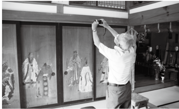
保存状況を確認する県文化財保護指導委員