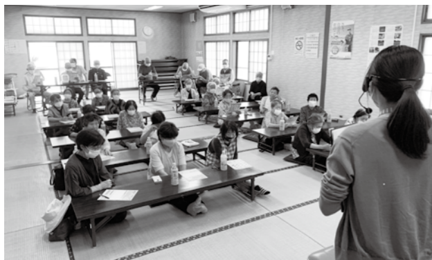
「塩分控えめ食」について学ぶ参加者

約30人が参加。町の管理栄養士が講師を務め、福島県は塩分の摂取量が全国でも特に高いことや、野菜や果物に含まれるカリウムが余分なナトリウム(塩分)を体の外に排出することなどを解説しました。参加者は塩分チェックシートを使って食事の塩分摂取量を確認したり、しょうゆの使用目安量などに考慮した「塩分控えめ食」について理解を深めていました。