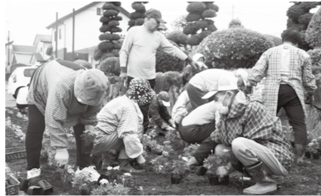
早朝からの作業、ありがとうございました

今回は、マリーゴールド、サルビア、ブルーサルビア、ペゴニア、アゲラタムの5種類の苗を、各地の花壇や主要道路の沿道、プランターに定植して頂きました。早朝からご協力いただいた町民の皆様、ありがとうございました。