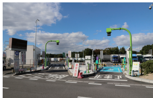
鏡石スマートICのETCゲート（上り線）