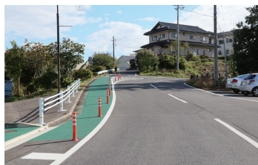
安全対策工事を行った町道仁井田笠石線