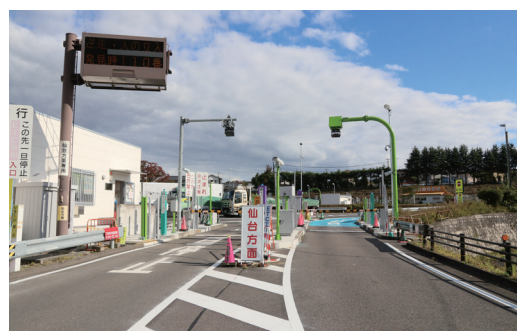
鏡石スマートICのETCゲート（下り線）