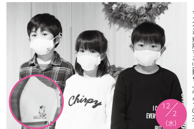
マスクを着用する児童ら（ぶどうの木）

町福祉子ども課では、新型コロナウイルス感染症対策の一環として、町内の保育施設に「牧場のあーさー♪」の絵柄が入ったオリジナルマスクを配布しました。 マスクは3～5歳児向けの布製で、岡ノ内幼稚園、認定子ども園ぶどうの木、鏡石保育所、鏡石幼稚園のほか、町外施設利用児童などの分も合わせ、計450枚を作製、配布しました。