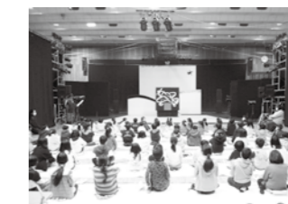
体育館が劇場のように変身

大がかりなセットで、体育館が劇場に変身したかのようでした。1～3年生と4～6年生に分かれ、2回公演していただきました。約2時間の公演となりましたが、演者の方と掛け合いをしたり、拍手を送ったりとお話の中に入り込み、真剣に見入っていました。身近に本格的なミュージカルを鑑賞できてとても良い経験となりました。