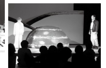
「星の王子さま」を上演