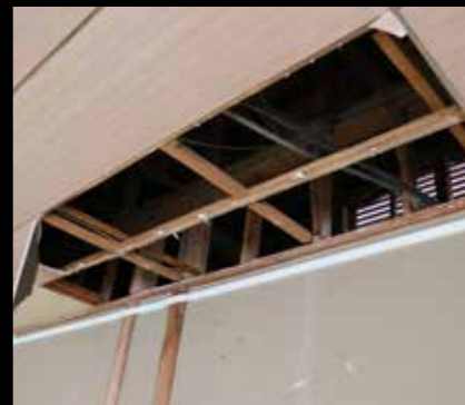
天井の一部が崩落した保健センター