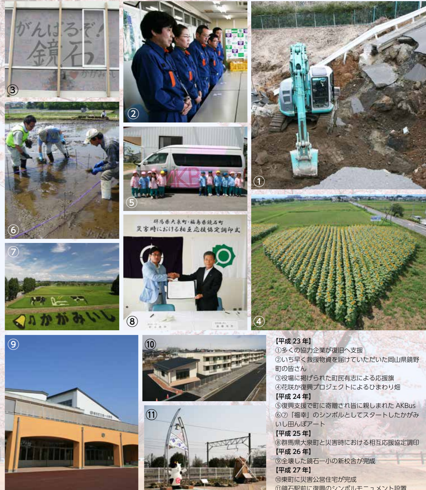
【平成 23 年】 ①多くの協力企業が復旧へ支援 ②いち早く救援物資を届けていただいた岡山県鏡野町の皆さん ③役場に掲げられた町民有志による応援旗 ④花咲か復興プロジェクトによるひまわり畑 【平成 24 年】 ⑤復興支援で町に寄贈され皆に親しまれた AKBus ⑥⑦「福幸」のシンボルとしてスタートしたかがみいし田んぼアート 【平成 25 年】 ⑧群馬県大泉町と災害時における相互応援協定調印 【平成 26 年】 ⑨全壊した鏡石一小の新校舎が完成 【平成 27 年】 ⑩東町に災害公営住宅が完成 ⑪鏡石駅前に復興のシンボルモニュメント設置

平成 23 年 3 月 11 日 14 時 46 分に発生した東日本大震災から、今年で 10 年一。 町内では震度 6 強を観測し、住宅に加え道路、水道、電気などの生活基盤も大きな打撃を受けました。 ここでは、町内外からいただいた多くの支援と、復興に向けて歩んできた町の 10 年間を振り返ります。