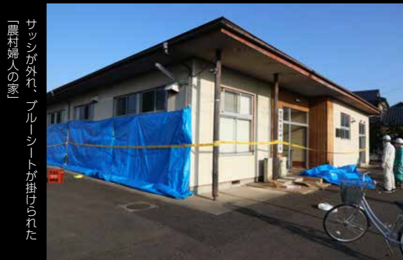
「農村婦人の家」サッシが外れ、ブルーシートが掛けられた