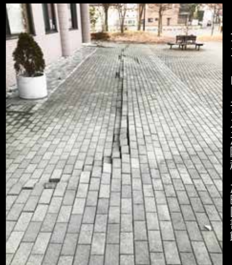
インターロッキングが隆起した町図書館