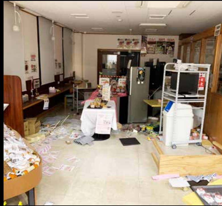
商品などが床に散乱した「かんかんてらす」の店内