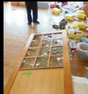
鏡石保育所では戸が倒れ、ガラスが飛び散る等の被害