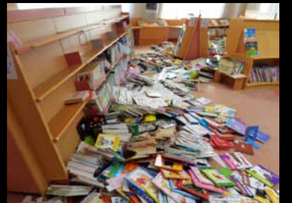
揺れにより蔵書が本棚から飛び出した町図書館内

今回の地震では、一般住宅や事業所などに加え、町の公共施設も大きな被害を受けました。 鏡石まちの駅「かんかんてらす」では、陳列してあった商品が床に落ち、びん類などが割れたほか、調理器具が破損するなどして、地震発生翌日は臨時休業を余儀なくされました。 また、町図書館では敷地内